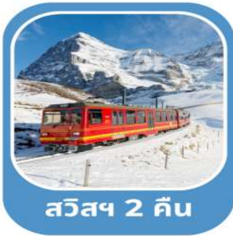
สวิสฯ 2 คืน