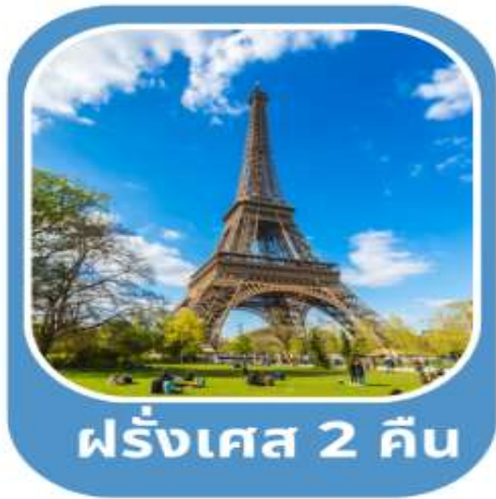
ฝรั่งเศส 2 คืน