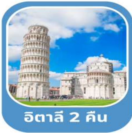
อิตาลี 2 คืน

โรม•นครรัฐวาติกัน•มหาวิหารเซ็นต์ปีเตอร์•โคลอสเซียม•น้ำพุเทรวี•บันโดสเปน มอนเตคาดีนี•ปีซ่า•หอเอนเมืองปีซ่า•ล่องเรือเกาะเวนิส•ชมเมืองมิลาน•อินเทอร์ลาเคน เลาเทอร์บรุนเนน•พีชิตยอดเขาจุงเฟรา•ชมเมืองลูเซิร์น•ทรัสส์•ปารีส เข้าชมพระราชวังแวร์ซายส์•ล่องเรือชมแม่น้ำแซนน์•ช้อปปิ้ง•มองมาร์ต