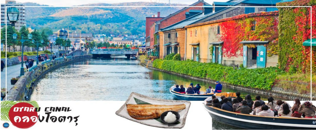
OTARU CANAL คลองโอตารุ

ท่าอากาศยานนิวซีโดเสะ สอกไกโด – เมืองโอตารุ – ผ่านชมคลองโอตารุ – พิพิธภัณฑ์กล่องดนตรี – เมืองซัปโปโร – หมู่บ้านซ็อคโกแลต อิชियะ (ด้านนอก) – ซ้อปิ้งทานุกิโคจิ