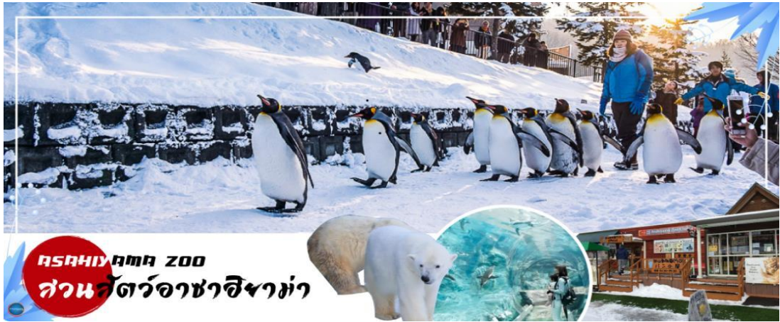
ASAHIYAMA ZOO สวนสัตว์อาซาฮิยาม่า

นำท่านเดินทางสู่ สวนสัตว์อาซาฮิยามะ (Asahiyama Zoo) (ใช้เวลาเดินทางประมาณ 30 นาที) เป็นสวนสัตว์ที่มีชื่อเสียงในแถบรอบนอกของเมืองอาซาฮิคาวะ กลางเกาะฮอกไกโด ซึ่งทางสวนสัตว์อนุญาตให้ผู้เข้าชม ได้เข้าชมสัตว์นานาชนิดจากหลากหลายมุมมอง เป็นเอกลักษณ์ที่ไม่เหมือนสวนสัตว์แห่งอื่นๆ ไฮไลท์!!! ได้แก่ อุโมงค์แก้วผ่านสระว่ายน้ำของเหล่าเพนกวินและโดมแก้วขนาดเล็กที่อยู่ตรงกลางของโซนหมีขั้วโลกและหมาป่า ผู้เข้าชมจะมองเห็นได้อย่างชัดเจน สวนสัตว์แห่งนี้ยังเป็นสวนสัตว์แห่งแรกที่มีการจัดให้เพนกวินออกเดินในช่วงฤดูหนาว ท่านจะได้ชม “ขบวนพาเหรดเพนกวิน” แบบใกล้ชิด (**หมายเหตุ เนื่องจากขบวนพาเหรดเพนกวินมีเป็นรอบ สงวนสิทธิ์หากท่านไปไม่ตรงช่วงเวลาที่มขบวนพาเหรด ให้ท่านได้เพลิดเพลินกับความน่ารักของสัตว์ชนิดอื่น ๆ ทดแทน)