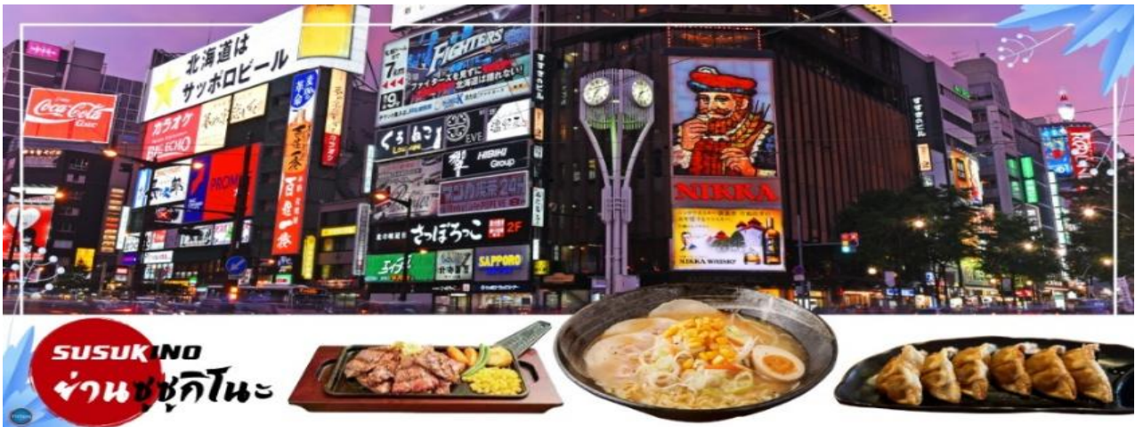
SUSUKINO ย่านซูซุกิโนะ

จากนั้นนำท่านเดินทางสู่ เมืองซัปโปโร (SAPPORO) (ใช้เวลาเดินทางประมาณ 3 ชั่วโมง) เพื่อนำท่านสู่ ย่านซูซุกิโนะ (Susukino) นับเป็นย่านที่เต็มไปด้วยแหล่งบันเทิงที่โด่งดังมากที่สุดของเมืองซัปโปโร(Sapporo) อีกทั้งยังเรียกได้ว่าเป็นย่านบันเทิงที่ใหญ่ที่สุดในทางตอนเหนือของญี่ปุ่นที่เดียวละคะ บอกเลยว่าอยากมาบันเทิงใจยามค่ำคืนสัมผัสไลฟ์สไตล์แบบคนญี่ปุ่นแท้ๆต้องมาที่นี่ให้ได้เลยละคะ เพราะเต็มไปด้วยร้านค้า บาร์ ร้านอาหาร ร้านคาราโอเกะ และตู้ปาจิงโกะ รวมกว่า 4,000 ร้าน บางร้านนี้เปิดจนถึงเที่ยงเที่ยงคืน