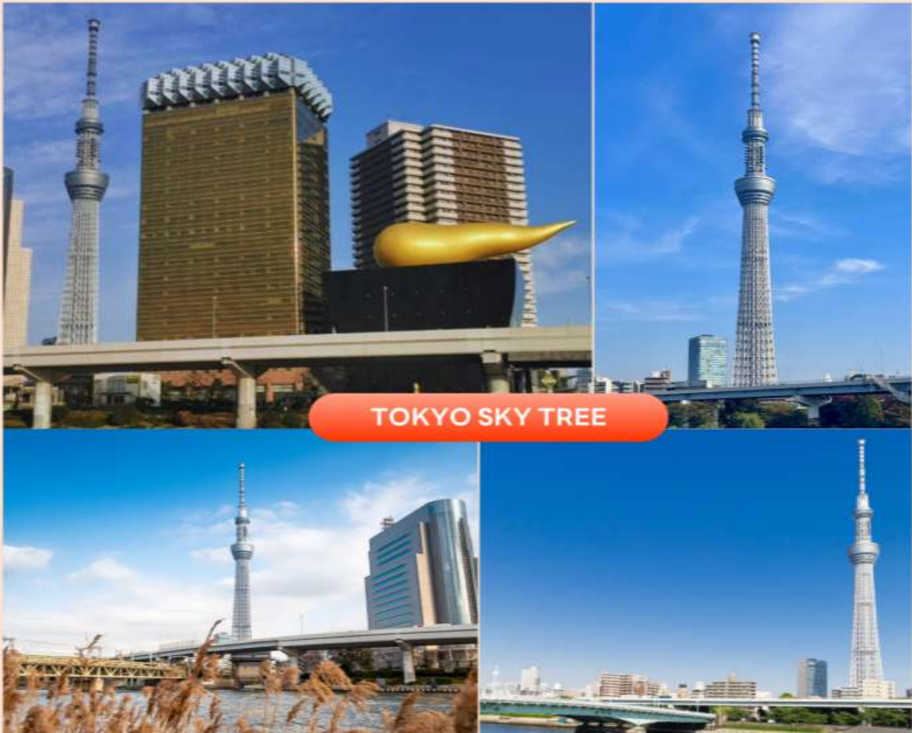
TOKYO SKY TREE

(Tokyo Sky Tree) ริมน้ำสุมิตะ (Sumida River) หอคอยที่สูงที่สุดในโลก จัดเป็นแลนด์มาร์คอีกอย่างหนึ่งของกรุงโตเกียวบริเวณริมน้ำสุมิตะ เป็นหอส่งสัญญาณโทรคมนาคมที่สูงที่สุดในโลก อิสระให้ท่านเก็บภาพตามอัธยาศัย ทิวทัศน์ของหอคอยโตเกียวสกายทรี สามารถมองเห็นได้จากทะเลสาบที่เต็มไปด้วยกลิ่นอายแบบเมืองเก่าของเอโดะ (ราคาทัวร์ไม่รวมค่าขึ้นหอคอย) ซึ่งริมน้ำสุมิตะนั้น ท่านสามารถเก็บภาพความประทับใจกับความสวยงามของวิวเมืองที่เต็มไปด้วยตึกระฟ้าที่มีหอคอยสูงตระหง่านตามอัธยาศัย