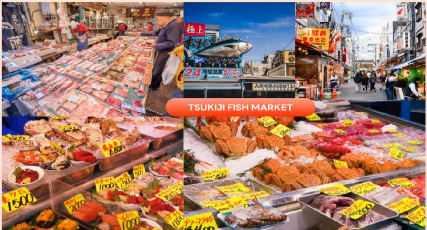
TSUKIJI FISH MARKET

คณะเดินทางถึง สนามบินนานาชาตินาริตะ ประเทศญี่ปุ่น (**เวลาที่ประเทศญี่ปุ่นจะเร็วกว่าประเทศไทย 2 ชม. ควรปรับนาฬิกาของท่านเพื่อสะดวกในการนัดหมาย) หลังผ่านพิธีตรวจคนเข้าเมืองแล้ว จากนั้นนำท่านสู่ เมืองโตเกียว (Tokyo) มหานครที่ใหญ่ที่สุดแห่งหนึ่งของเอเชีย และของโลก ประกอบด้วยแหล่งท่องเที่ยว แหล่งวัฒนธรรม ศูนย์รวมเศรษฐกิจ เทคโนโลยีทางด้านต่าง ๆ และสถานที่สำคัญทางศาสนา มากมายในมหานครแห่งนี้ที่ผสมผสานกันได้อย่างลงตัว นำท่านเดินทางสู่ ตลาดปลาซึกิจิ (Tsukiji) เป็นตลาดอาหารทะเลชื่อดังของโตเกียวเป็นหนึ่งในตลาดปลาที่ใหญ่ที่สุดในโลก เป็นแหล่งรวมอาหารทะเลสดใหม่ และอาหารญี่ปุ่นต้นตำรับ ภายในตลาดเต็มไปด้วยร้านซูชิ ซาซิมิ อาหารทะเลสด รวมถึงขนมและของฝากท้องถิ่นมากมาย ให้ท่านอิสระเลือกชิมและเลือกซื้อสินค้าตามอัธยาศัย