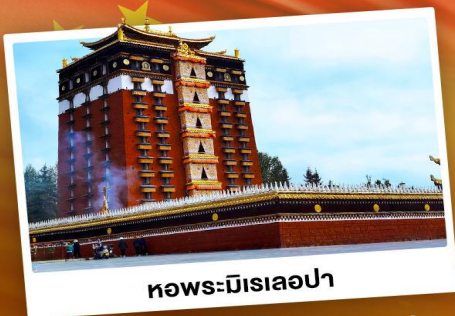
ทอพระมีเรเลอปา