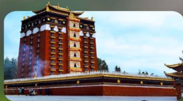
หอพระมิเรลอป้า