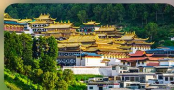
วัดหล่างมู่ซือ