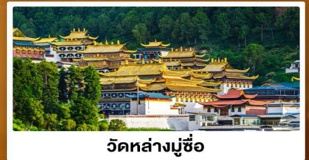
วัดหล่างมูชื่อ