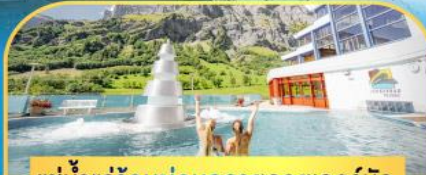
แช่น้ำแร่ร้อนผ่อนคลายลวยคอร์นิต