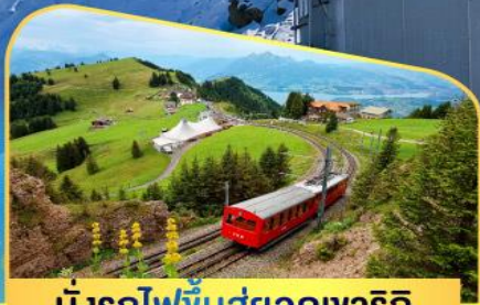
นั่งรถไฟขึ้นสู่ยอดเขาริกิ