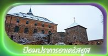
ป้อมปราการอาครัสตุส