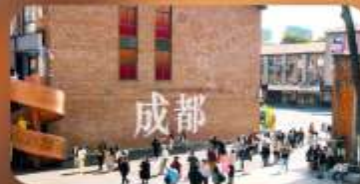
ดงเจียวจี้