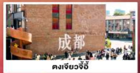
ตงเจียวจื่อ