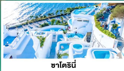
ซาไดร์นี่