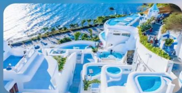
ซาโตรินี่