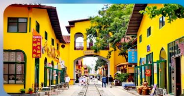
หมาหยวนมีเตอร์เกจ