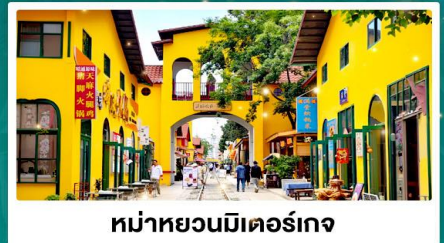
หม่าหยวนมิเตอร์กง