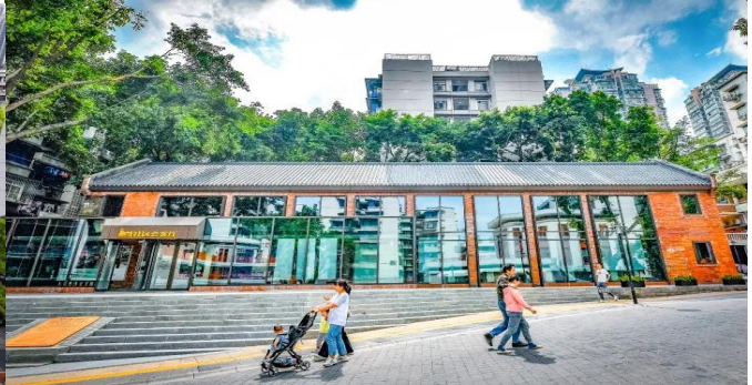
กลางวัน รับประทานอาหารกลางวัน ณ ภัตตาคาร (มือที่ 11)

นำท่านเดินทางสู่ ถนนคนเดินเอ๋อหลิ่ง จากโรงงานพิมพ์ธนบัตร สู่แลนด์มาร์กศิลปะสุดฮิปแห่งฉงชิ่ง ท่ามกลางภูเขา ถนนลาดชัน และตึกสูงอันเป็นเอกลักษณ์ของมหานครฉงชิ่ง มีสถานที่แห่งหนึ่งที่สะท้อนเสน่ห์ของ “เมืองเก่าและเมืองใหม่” ได้อย่างสมบูรณ์แบบ นั่นคือ “TESTBED2” แลนด์มาร์กสายอาร์ตที่กำลังกลายเป็นหัวใจของวัฒนธรรมสร้างสรรค์ในเมืองฉงชิ่ง เดิมทีสถานที่แห่งนี้เป็น “โรงพิมพ์ธนบัตรกลาง” ที่ก่อตั้งขึ้นในปี 1937 ในยุคสาธารณรัฐจีน ก่อนจะเปลี่ยนชื่อเป็น โรงพิมพ์หมายเลข 2 ของฉงชิ่งในปี 1953 ซึ่งเคยเป็นศูนย์กลางงานพิมพ์ที่สำคัญที่สุดแห่งหนึ่งของจีนตะวันตกเฉียงใต้ ทั้งธนบัตร แสตมป์ ตัว และเอกสารราชการจำนวนมาก ล้วนเคยถูกผลิตจากที่นี่