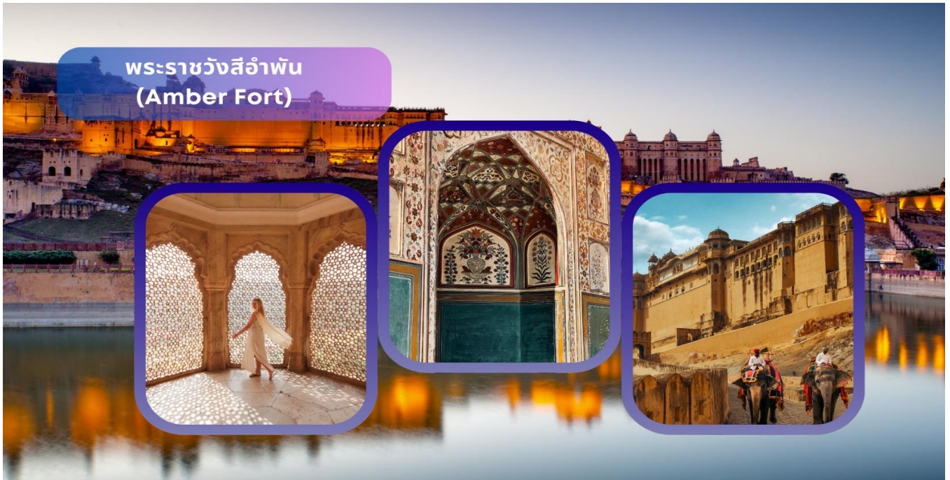
พระราชวังสีอำพัน (Amber Fort)

เมืองชัยปุระ PINK CITY สีแห่งความรัก เมืองหลวงแห่งรัฐราชาสถาน แคว้นที่มีขนาดใหญ่ที่สุดของประเทศอินเดีย เมืองแห่งนี้ถูกก่อตั้งขึ้นในปี คริสต์ศักราช 1727 โดยมหาราชาไสวจัย ซิงห์ ที่ 2 ผู้สืบเชื้อสายแห่งราชวงศ์โมกุล โดยมีวัตถุประสงค์ของการสร้างเมืองชัยปุระเพื่อเป็นการแทนที่ พระราชวังแอมเบอร์ฟอร์ท (AMBER FORT) อันมีสาเหตุมาจากจำนวนประชากรที่มีการขยายตัวเพิ่มขึ้น และเกิดสภาวะขาดแคลนแหล่งน้ำ