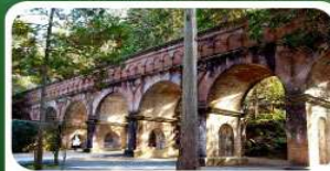
วัดนินเซ็นจิ