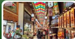
ตลาดปลาชิชิ