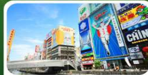
ช้อปปิ้งย่านชินโซบาชิ