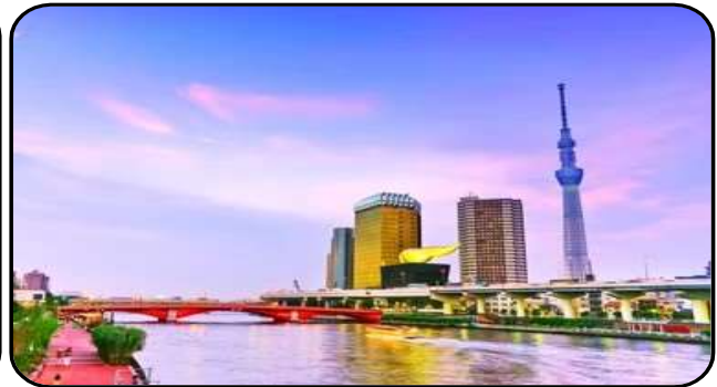
แม่น้ำซูมิดะ

สักการะ วัดมัตสึจิยามะโชเต็น หรือ “วัดหัวไชเท้า” ซึ่งเป็นวัดเก่าแก่ในย่านอาซากุสะ เป็นวัดเก่าแก่ในย่านอาซากุสะ กรุงโตเกียว ตั้งอยู่บนเนินเขาเล็ก ๆ ริมแม่น้ำซูมิดะ จุดเด่นคือเป็นวัดที่ขึ้นชื่อเรื่อง “ขอพรด้านการเงิน” โชคลาภ และความสำเร็จในธุรกิจ ส่วนไฮไลต์สำคัญของวัดนี้คือ ไตคอน หรือหัวไชเท้า สัญลักษณ์ศักดิ์สิทธิ์ คนที่นี่เชื่อว่าไตคอนช่วย “ชำระล้างสิ่งไม่ดี” และนำโชคลาภเข้ามา นักท่องเที่ยวมักนำไตคอนไปถวายเพื่อขอพร