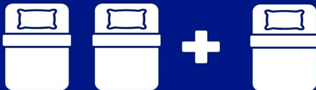
ห้องพักสำหรับสามท่าน (ที่นอนเสริม) TRIPLE BED ROOM (TRP)