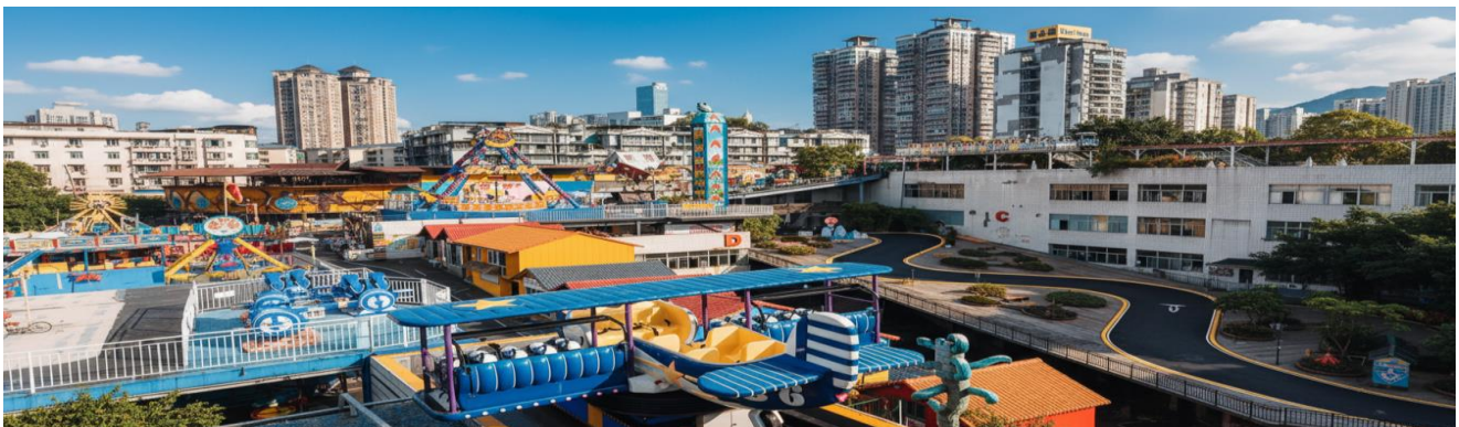
2UCKG-CZ005 บินตรงฉงชิ่ง ฟรีคอม ฟรีเคย์ สนุกสุดคุ้ม มหานครแปดมิติ 5 วัน 3 คืน โดยสายการบิน ไชมา เซาเทิร์น (CZ)

เช้า รับประทานอาหารเช้า ณ ห้องอาหารของโรงแรม (เมื่อที่ 7)