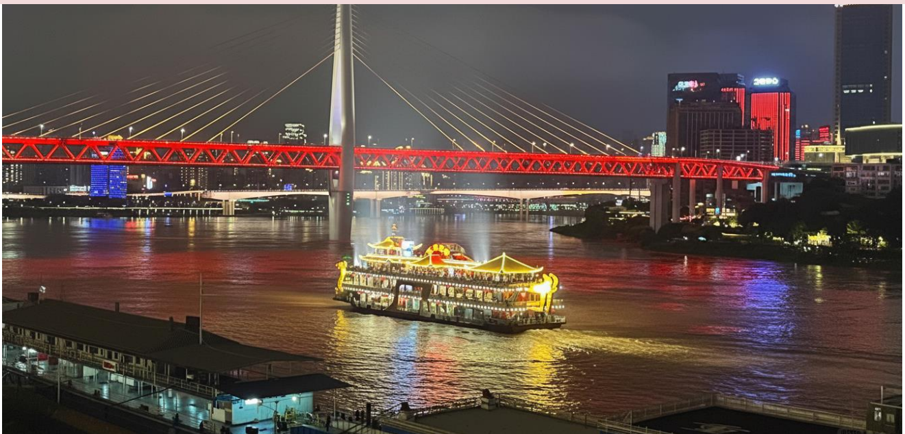
2UCKG-CZ005 บินตรงฉงชิ่ง ฟรีคอม ฟรีเคย์ สนุกสุดคุ้ม มหานครแปดมิติ 5 วัน 3 คืน โดยสายการบิน ไชน่า เซาเทิร์น (CZ)

หมายเหตุ สำหรับท่านที่ไม่ได้เข้าร่วมโปรแกรมเสริม: ทางบริษัทฯ ให้ท่านได้อิสระซื้อป๊ิง ญ ย่านซื้อป๊ิง ไกล่เคียง และเพื่อให้การเดินทางของท่านเป็นไปอย่างราบรื่น ปลอดภัย และเป็นไปตามมาตรฐานของทัวร์ทางบริษัทฯ ขอความร่วมมือให้ท่านสำรองโปรแกรมเสริมผ่านหัวหน้าทัวร์หรือมัคคุเทศก์ท้องถิ่นที่ได้รับมอบหมายเท่านั้น ทั้งนี้เพื่อประโยชน์สูงสุดในด้านราคา ความปลอดภัย และการบริหารจัดการเวลาของคณะทัวร์โดยรวม