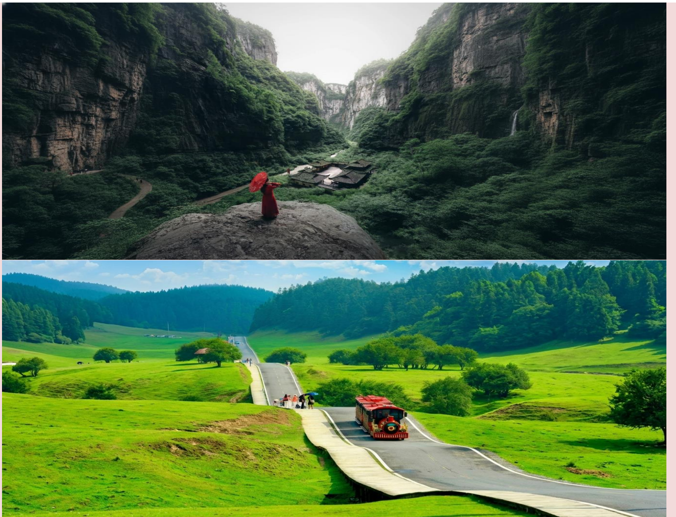
2UCKG-CZ005 บินตรงฉงชิ่ง ฟรีคอม ฟรีเคย์ สนุกสุดคุ้ม มหานครแปดมิติ 5 วัน 3 คืน โดยสายการบิน ไชน่า เซาเทิร์น (CZ)