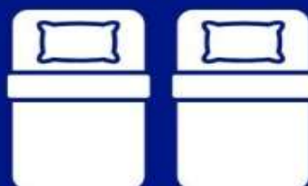
ห้องพักเตียงคู่ TWIN BED ROOM (TWN)

ห้องพักสำหรับ 1 ท่าน มีค่าใช้จ่ายเพิ่มจากค่าตัว