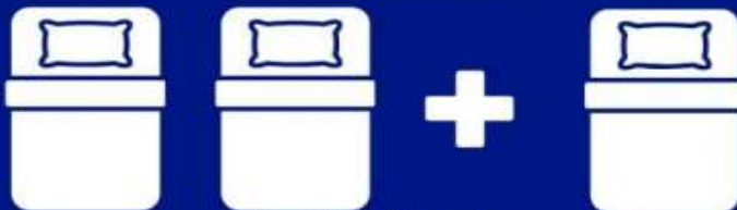
ห้องพักสำหรับสามท่าน (ที่นอนเสริม) TRIPLE BED ROOM (TRP)