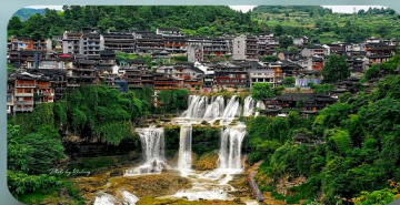
หมู่บ้านฟุหรงเจิ้น