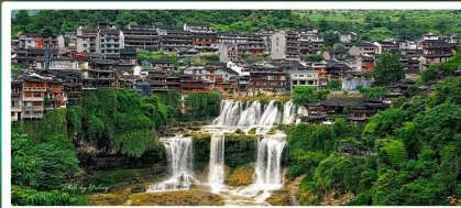
หมู่บ้านฟุ่หลงเจิน