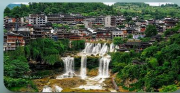
หมู่บ้านพูรงเจิ้น