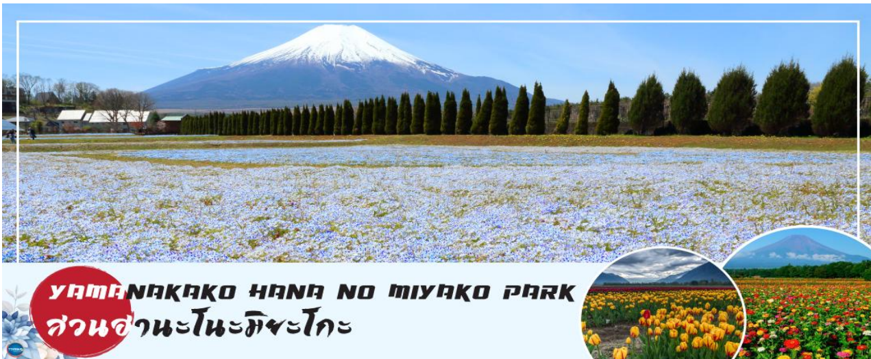
YAMANAKAKO HANA NO MIYAKO PARK สวนसानะโนะมียาโกะ