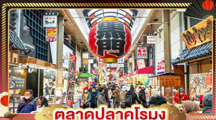
ตลาดปลาคุโรมง