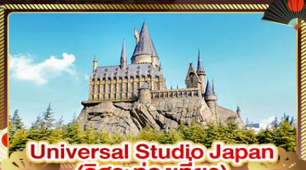
Universal Studio Japan (อิสระท่องเที่ยว)