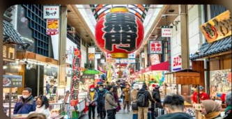
ตลาดปลาคูโรมง

FIVE Osaka Hotel หรือเทียบเท่ามาตรฐานญี่ปุ่น