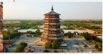
วัดเจดีย์ไม้ มู่ตา