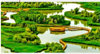
อุทยานพื้นที่ชุ่มน้ำจางเย่