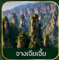
จางเจียเจีย