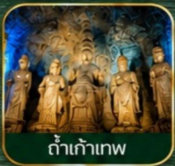
ดำเก้าเทพ