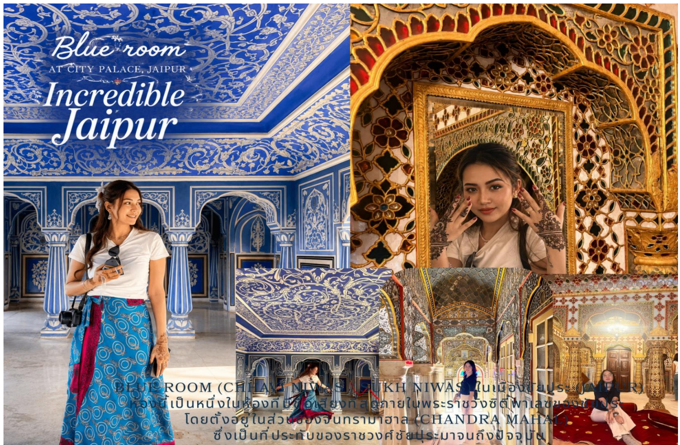
BLUE ROOM (CHANDRA NIWAS) AT CITY PALACE, JAIPUR ผนังเป็นหนึ่งใบทองคำ ผนังสีทองกลายในพระราชวังซิตี้พาลาซของราชวงศ์ โดยตั้งอยู่ในส่วนของจันทรมาฮาล (CHANDRA MAHAL) ซึ่งเป็นที่ประทับของราชวงศ์ชัยปุระมาจนถึงปัจจุบัน

กลางวัน รับประทานอาหารกลางวัน ณ ที่ห้องอาหาร (มื้อที่ 4)