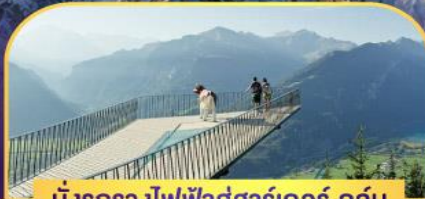
นั่งรกรางไฟฟ้าสู่ฮาร์เคอร์ คูล์ม