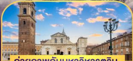
ถ่ายภาพกับมหาวิหารดูริน