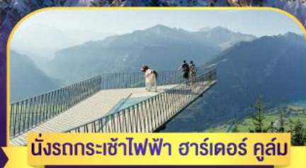
นั่งรถกระเช้าไฟฟ้า ฮาร์คอร์ คูส์ม