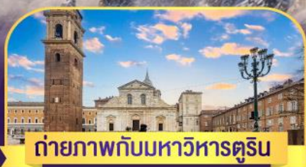
ถ่ายภาพกับมหาวิหารคูริน