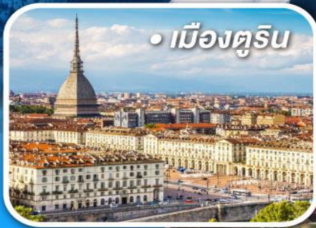
• เมืองตูริน