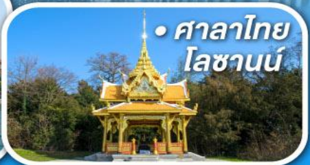
• ศาลาไทย โลซานน์

• สูดอากาศดีที่เซอร์แมท • ขึ้นกระเช้าสู่ยอดเขากลาเซียร์ 3000 • ชมเมืองคลาสสิกเบิร์น ลูเซิร์น ซูริก