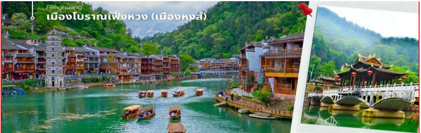
Fenghuang เมืองโบราณเฟิ่งหวง (เมืองหงส์)

รถของอุทยานเฟิ่งหวง นำท่าน นั่งเรือพายลงแม่น้ำถั่วเจียง ชมบ้านเรือนโบราณห้อยยาสองฝั่งแม่น้ำถั่วเจียงอันเป็นเอกลักษณ์ของเมืองโบราณแห่งนี้ สัมผัสวิถีชีวิตที่ของชนเผ่าพื้นเมืองที่อาศัยอยู่บริเวณชุมชนนี้มาช้านาน