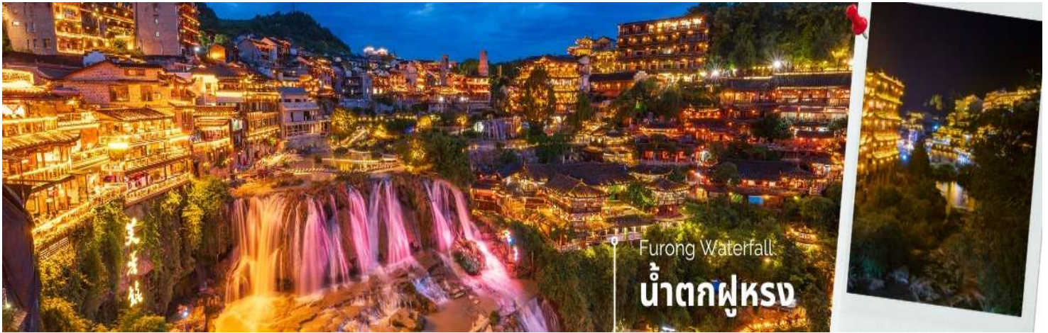
📍 พักที่เมืองฟูรงเจิ้น Jun Ya Hotel ระดับ 4 ดาว หรือเทียบเท่า

หลังอาหารมีเวลาให้ท่านชมแสงสียามค่ำคืนของน้ำตกฟูรงและเมืองเก่าถือเป็นจุดไฮไลท์ที่ขึ้นชื่อของเมืองแห่งนี้สมควรแก่เวลานำท่านนั่งรถบดเตอร์รี่ เพื่อไปยังลานจอดรถ จากนั้นนำท่านเดินทางสู่ที่พัก