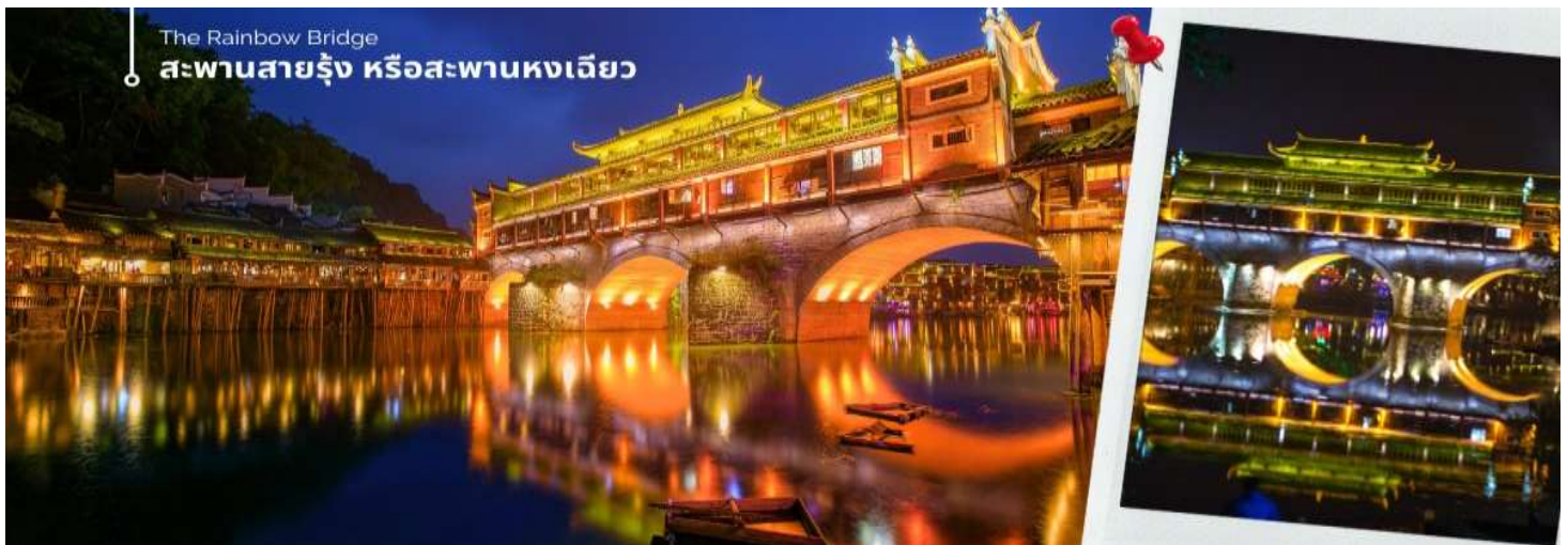
The Rainbow Bridge สะพานสายรุ้ง หรือสะพานหงเจียว

นำท่านชม สะพานสายรุ้ง (The Rainbow Bridge) หรือสะพานหงเจียว เป็นสะพานไม้โบราณที่มีหลังคาคลุมเหมือนสะพานข้ามคลองในเวนิส ตั้งอยู่ในเมืองเฟิ่งหวาง จุดเด่นอีกแห่งหนึ่งที่อยู่ใกล้สะพานนี้ก็คือ บ้านบริเวณที่สะพานหงเจียว จยกพื้นสูงเรียงรายกันบนริมน้ำที่ใสสะอาดจนเห็นกันบึง ซึ่งเป็นทัศนียภาพที่สวยงาม ที่ทั้งชาวจีนและชาวต่างประเทศนิยมเดินทางมาเที่ยวชมที่นี่ ชมแสงสียามค่ำคืนของเมืองเก่า จุดไฮไลต์ที่ขึ้นชื่อของเมืองแห่งนี้