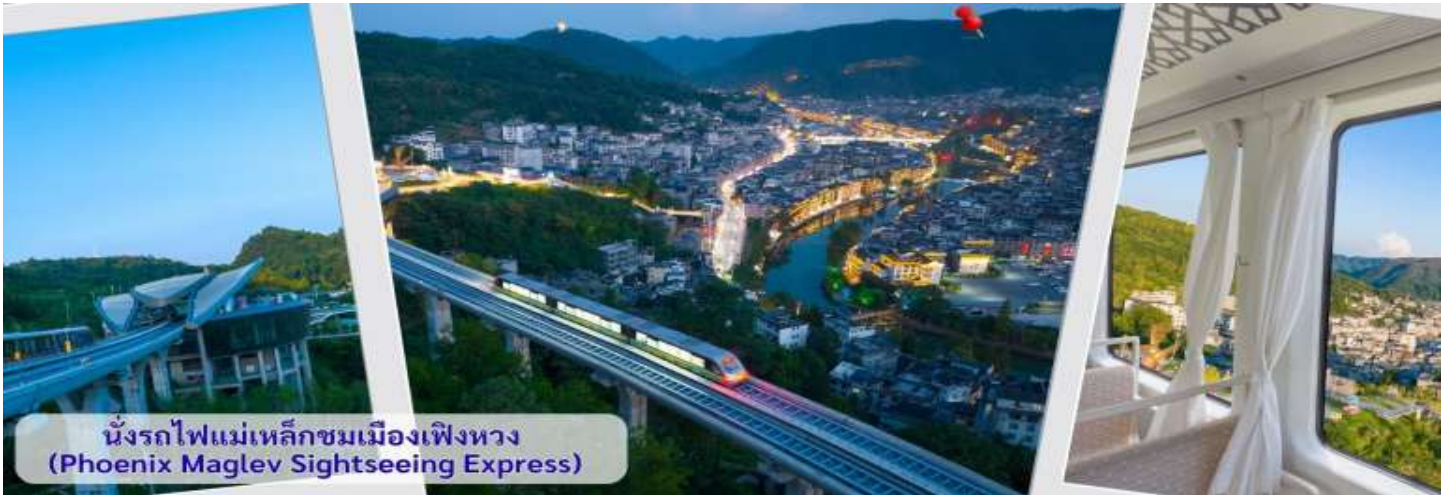
นั่งรถไฟแม่เหล็กชมเมืองเฟิงหวง (Phoenix Maglev Sightseeing Express)

จากนั้นนำทุกท่าน เดินถนนโบราณ Feng Hueng Ancient Town ที่ถนนชื้อปิ่น Shibian Street เมืองที่ยังคงรักษาเอกลักษณ์ความเป็นพื้นเมืองผสมผสานกับยุคปัจจุบันเอาไว้ได้อย่างลงตัววิถีชีวิตของชาวบ้านที่อาศัยอยู่ที่นี่ บรรยากาศในเมืองเฟิงหวง ถนนเก่าชื้อปิ่นเป็นถนนปูหินแคบๆ กว้างไม่ถึง 5 เมตร ทอดยาวจากทางเข้วัดเต้าเหมินไปทางทิศตะวันตก ผ่านถนนหลายสาย ได้แก่ ถนนครอส ถนนเจิ้งตะวันออก ถนนเจิ้งตะวันตก ศาลาฮุยหลง หียงเซียวซง เต้าชานลา ศาลาเจี้ยกั๋ว และสุสานเฉินฉงเหวิน สุดท้ายจะนำไปสู่ “น้ำพุแรกใต้ฟ้า” ถนนสายนี้มีความยาวกว่า 3,000 เมตร และเป็นย่านการค้าที่คึกคักที่สุดในเฟิงหวง