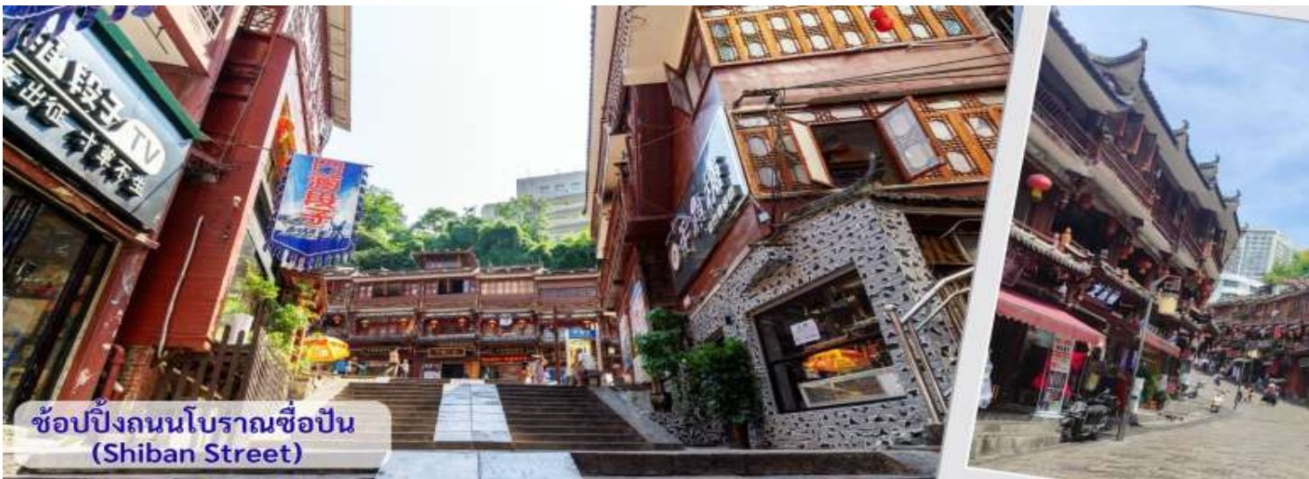
ช้อปปิ้งถนนโบราณชื้อปิ่น (Shiban Street)

จากนั้นนำทุกท่าน เดินถนนโบราณ Feng Hueng Ancient Town ที่ถนนชื้อปิ่น Shibian Street เมืองที่ยังคงรักษาเอกลักษณ์ความเป็นพื้นเมืองผสมผสานกับยุคปัจจุบันเอาไว้ได้อย่างลงตัววิถีชีวิตของชาวบ้านที่อาศัยอยู่ที่นี่ บรรยากาศในเมืองเฟิงหวง ถนนเก่าชื้อปิ่นเป็นถนนปูหินแคบๆ กว้างไม่ถึง 5 เมตร ทอดยาวจากทางเข้วัดเต้าเหมินไปทางทิศตะวันตก ผ่านถนนหลายสาย ได้แก่ ถนนครอส ถนนเจิ้งตะวันออก ถนนเจิ้งตะวันตก ศาลาฮุยหลง หียงเซียวซง เต้าชานลา ศาลาเจี้ยกั๋ว และสุสานเฉินฉงเหวิน สุดท้ายจะนำไปสู่ “น้ำพุแรกใต้ฟ้า” ถนนสายนี้มีความยาวกว่า 3,000 เมตร และเป็นย่านการค้าที่คึกคักที่สุดในเฟิงหวง