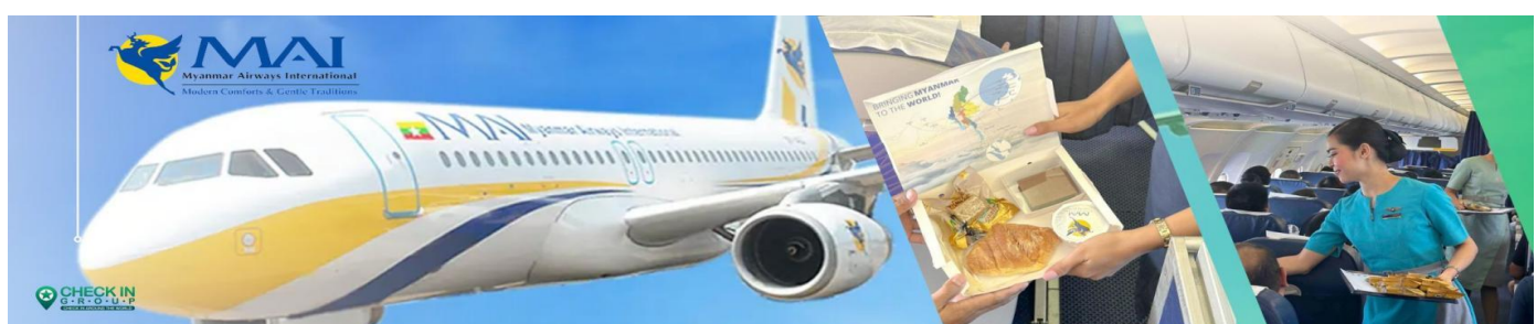
C8MR6 ย่างกุ้ง หงสาวดี มหาเจดีย์ชเวดากอง - ขอพรเทพทันใจ 3 วัน 1 คืนบิน Myanmar airways 8M

03.10 น. เดินทางถึงสนามบินนานาชาติย่างกุ้ง นำท่านผ่านด่านตรวจคนเข้าเมืองและศุลกากร นำท่านขึ้นรถโค้ชปรับอากาศ (ประเทศเมียนมาร์ เวลาช้ากว่าประเทศไทย 30 นาที)