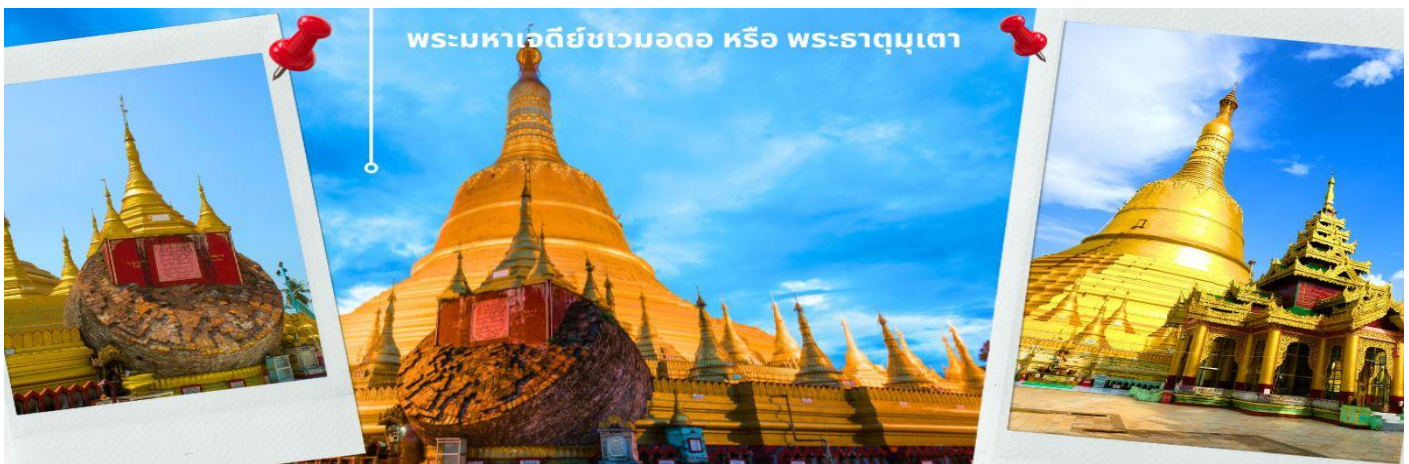
พระมหาเจดีย์ชเวมอดอ หรือ พระธาตุมุเตา

ท่านกราบนมัสการ พระมหาเจดีย์ชเวมอดอ หรือ พระธาตุมุเตา เจดีย์ที่เป็น 1 ใน 5 สิ่งศักดิ์สิทธิ์สูงสุดแห่งพม่า เจดีย์ชเวมอดอมีชื่อเรียกในภาษามอญซึ่งคนไทยคุ้นเคยกับชื่อนี้คือ พระธาตุมุเตา แปลว่า "จอมกร้อน" เพราะกล่าวกันว่าพระเจดีย์องค์นี้สูงมาก ต้องแหงนหน้ามองจนต้องกับแสงแดด ปัจจุบันเจดีย์ชเวมอดอมีความสูงที่ 114 เมตร เป็นเจดีย์ที่สูงที่สุดในประเทศพม่า ในสมัยพระเจ้าตะเบ็งชเวตี้ ใช้เป็นที่ทำพระราชพิธีเจ้าพระกรรมเมื่อครั้งพระองค์ขึ้นครองราชย์ใหม่ ๆ ที่ต้องอยู่ ภายใต้วงล้อมของทหารมอญหลายหมื่นนายที่เป็นศัตรู แต่ก็ไม่อาจทำอะไรพระองค์ได้ ภายหลังพระเจ้าตะเบ็งชเวตี้สามารถยึดพะโคเป็นราชธานีแห่งใหม่ได้สำเร็จ ในรัชกาลต่อมา คือ พระเจ้าบุเรงนองได้มีการสร้างฉัตรถวายเพิ่มเติมอีกหลายชั้น จนพระเจดีย์สูงขึ้นไปอีกหลายเท่า