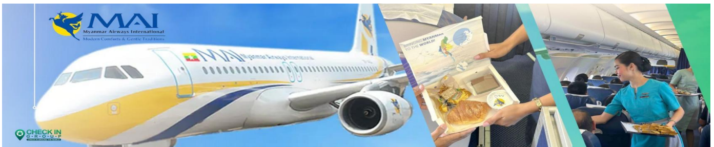
C8MR6 ย่างกุ้ง หงสาวดี มหาเจดีย์ชเวดากอง - ขอพรเทพทันใจ 3 วัน 1 คืนบิน Myanmar airways 8M

03.10 น. เดินทางถึงสนามบินนานาชาติย่างกุ้ง นำท่านผ่านด่านตรวจคนเข้าเมืองและศุลกากร นำท่านขึ้นรถโค้ชปรับอากาศ (ประเทศเมียนมาร์ เวลาช้ากว่าประเทศไทย 30 นาที)