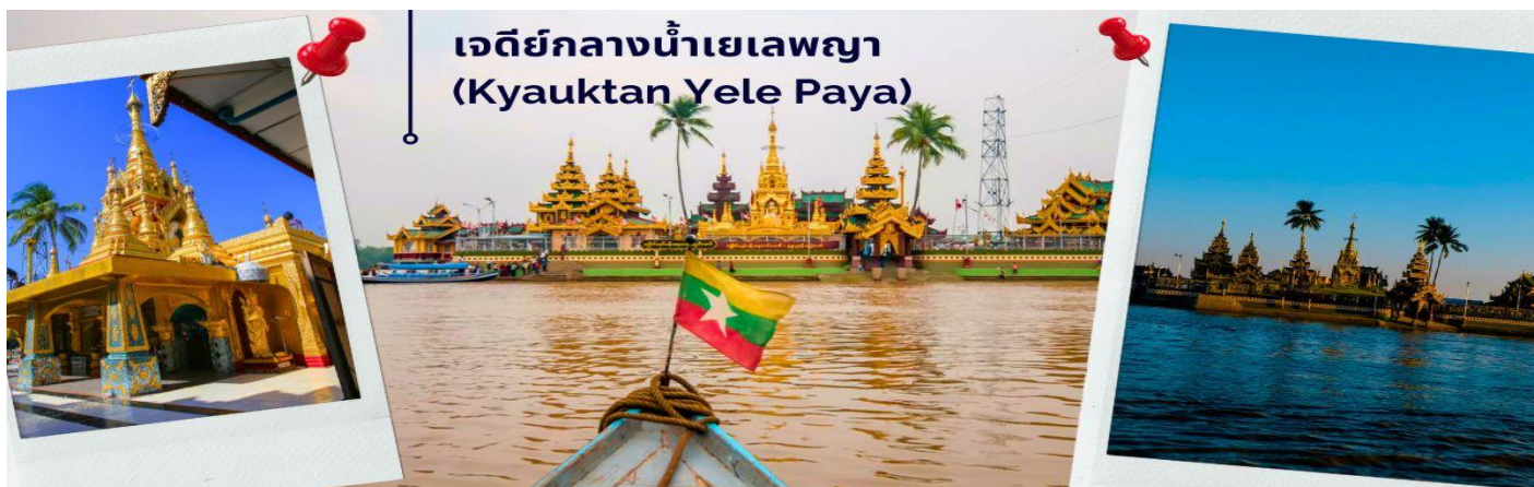
เจดีย์กลางน้ำเยเลพญา (Kyauktan Yele Paya)

นำท่านออกเดินทางสู่ เมืองสิเรียม (ใช้เวลาเดินทางประมาณ 45 นาที) ตาน-ถยิน หรือ เซอ้ง ในอดีตไทยเรียก เสี่ยง มีชื่อเดิมที่เป็นที่รู้จักกันโดยทั่วไปว่า สิเรียม เป็นเมืองท่าสำคัญของภาคย่างกุ้ง ประเทศพม่า ตั้งอยู่ปากแม่น้ำอิรวดี อดีตเป็นเมืองท่าชั้นนอกของพะโคหรือหงสาวดี เคยเป็นที่มั่นของทหารโปรตุเกสที่ช่วยเหลือชาวมอญทำสงครามกับพม่า ตั้งแต่คริสต์ศตวรรษที่ 16 เจดีย์กลางน้ำเยเลพญา (Kyauktan Yele Paya) เจดีย์นี้สร้างขึ้นบนเกาะกลางน้ำ เรียกอีกชื่อหนึ่งว่า “เจดีย์กลางน้ำ” เป็นที่สักการะของชาวสิเรียม ที่บริเวณท่าเทียบเรือบนเกาะ พร้อมนมัสการพระพุทธรูปทรงเครื่องจักรพรรดิเก่าแก่ ที่ประดิษฐานบนบัลลังก์ไม้แกะสลักปิดทองคำเปลว ที่งดงามมีอายุนับพันปี ซึ่งเป็นที่