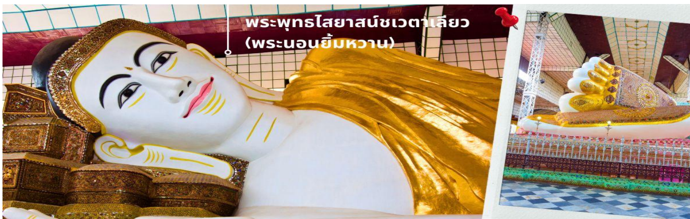
พระพุทธรูปไสยาสน์ชเวตาเลียว (พระนอนยี่มหวาน)

นำท่านสักการะ พระพุทธรูปไสยาสน์ชเวตาเลียว เป็นปูชนียสถานศักดิ์สิทธิ์อันดับสองของเมืองหงสาวดี รองจากมหาเจดีย์มูเตตา หรือที่คนไทยรู้จักกันในชื่อ "พระนอนยี่มหวาน" พระนอนชเวตาเลียว หรือ พระพุทธรูปไสยาสน์ชเวตาเลียว มีอายุเก่าแก่กว่า ๑,๒๐๐ ปี คนไทยรู้จักในนาม พระนอนยี่มหวาน เนื่องจากพระพักตร์ของท่านได้รับการวาดตกแต่งไว้อย่างสวยงามพร้อมด้วยรอยยี่มหวาน องค์พระเป็นศิลปะแบบมอญท่านสามารถที่จะเลือกหา เครื่องไม้แกะสลัก ที่มีให้เลือกมากมายตลอดสองข้างทางที่จะเดินเข้าไปสักการะองค์พระนอน และสินค้าพื้นเมืองอื่นๆ อาทิเช่น ผ้าพม่า ของที่ระลึกต่างๆอีกมากมาย