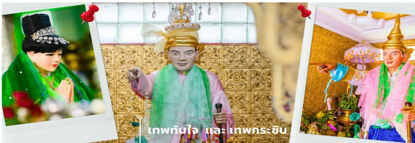
เทพทันใจ และ เทพกระซิบ

โดยใกล้กันยังมี เทพกระซิบ ซึ่งมีนามว่า “อะมาดอร์เม็ยะ ตามตำนานกล่าวว่า นางเป็นธิดาของพญานาค ที่เกิดศรัทธาในพุทธศาสนาอย่างแรงกล้า รักษาศีล ไม่ยอมกินเนื้อสัตว์จนเมื่อสิ้นชีวิตไปกลายเป็นนัต ซึ่งชาวพม่าเคารพกราบไหว้กันมานานแล้ว การขอพรเทพกระซิบต้องเข้าไปกระซิบเบาๆ ห้ามคนอื่นได้ยิน การบูชาเทพกระซิบ บูชาด้วย น้่านม ข้าวตอก ดอกไม้ และผลไม้