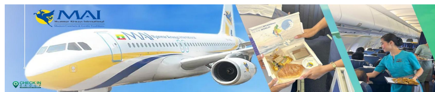
C8MR6 ย่างกุ้ง หงสาวดี มหาเจดีย์ชเวดากอง - ขอพรเทพทันใจ 3 วัน 1 คืนบิน Myanmar airways 8M

02.20 น. ✈️ นำท่านเดินทางสู่เมืองย่างกุ้ง ประเทศเมียนมาร์ โดย เที่ยวบินที่ 8M391 (มีบริการอาหารว่าง) 03.10 น. เดินทางถึงสนามบินนานาชาติย่างกุ้ง นำท่านผ่านด่านตรวจคนเข้าเมืองและศุลกากร นำท่านขึ้นรถโค้ชปรับอากาศ (ประเทศเมียนมาร์ เวลาช้ากว่าประเทศไทย 30 นาที)