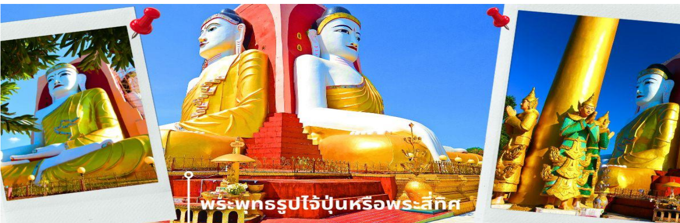
พระพุทธรูปไ้ปุ่บหรือพระลีทิต

ท่านนั้สการ พระพุทธรูปไ้ปุ่บหรือพระลีทิต เป็นพระเจดีย์ที่มีพระพุทธรูปปางมารวิชัยขนาดใหญ่ทั้ง 4 ด้านอายุกว่า 500 ปี หันพระพักตร์ไปยัง 4 ทิศ สร้างขึ้นโดย 4 สาวพี่น้องที่อุทิศตนแต่พุทธศาสนาจึงสร้างพระพุทธรูปเพื่อแทนตนเอง และได้สาบานไว้ว่าจะไม่ข้องแะกับบุรุษเพศ ต่อมาน้องสาวคนสุดท้อง กลับพบรักกับชายหนุ่มและแต่งงานกัน จึงเกิดอาเพศฟ้าผ่าพระพุทธรูปที่แทนตัวของน้องสาวคนสุดท้องพังทลายลงมา และมีการบูรณะขึ้นมาใหม่จึงทำให้พระพุทธรูปองค์นี้จะมีลักษณะ แตกต่างจากองค์อื่นๆ