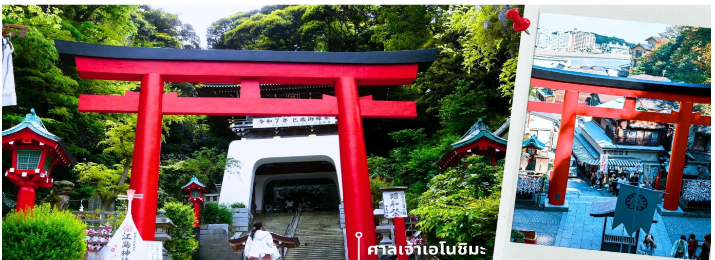
📍 ศาลเจ้าเอโนชิมะ

จากนั้นนำท่านสักการะ ศาลเจ้าเอโนชิมะ ศาลเจ้าศักดิ์สิทธิ์ที่ตั้งอยู่บนเนินเขาของเกาะ โดดเด่นด้วยบันไดทางขึ้น ที่ทอดยาวผ่านซุ้มประตูโทริอิและอาคารศาลเจ้าหลายจุดเรียงต่อกัน ภายในประดิษฐานเทพเบนไซเท็น เทพแห่งโชค ลาภ ศิลปะ และความสำเร็จ บรรยากาศโดยรอบเงียบสงบ รายล้อมด้วยธรรมชาติ เหมาะสำหรับการขอพรและ สัมผัสวัฒนธรรมญี่ปุ่นแบบดั้งเดิม จากนั้นให้ท่านได้อิสระเดินเล่นบริเวณ ถนนเบนเซนเท็น นากามิสะ ซึ่งเป็นถนน