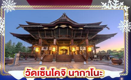
วัดเซ็นโคจิ นากาโนะ