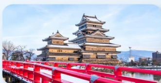
ปราสาทมิตสึโมโตะ