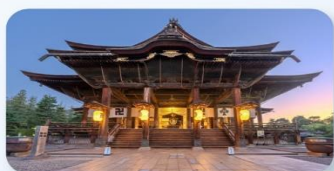
วัดเซ็นโคจิ นากาโนะ