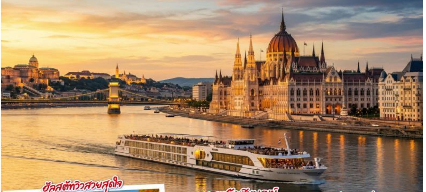
อัลสตัดท์ทิวสวสคูไล