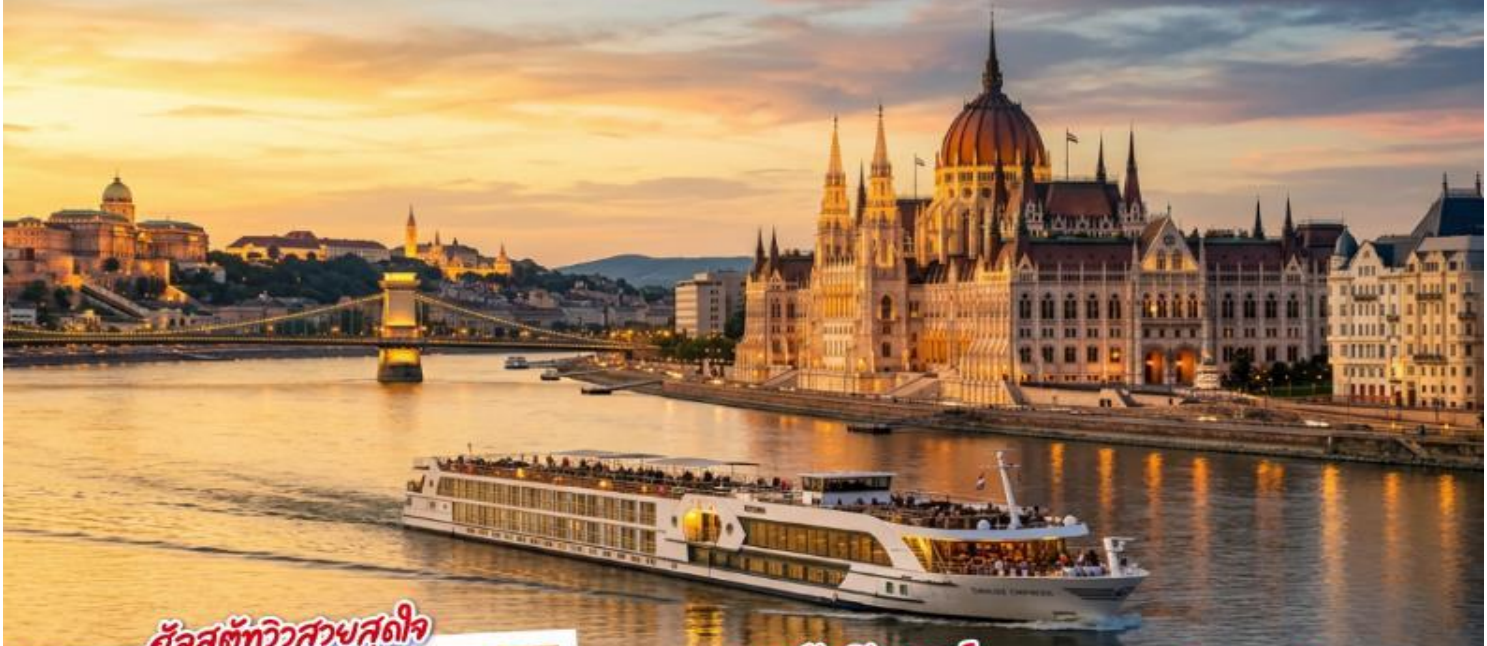
อัลสตัดท์ทิวสวางส์ตุลจ์