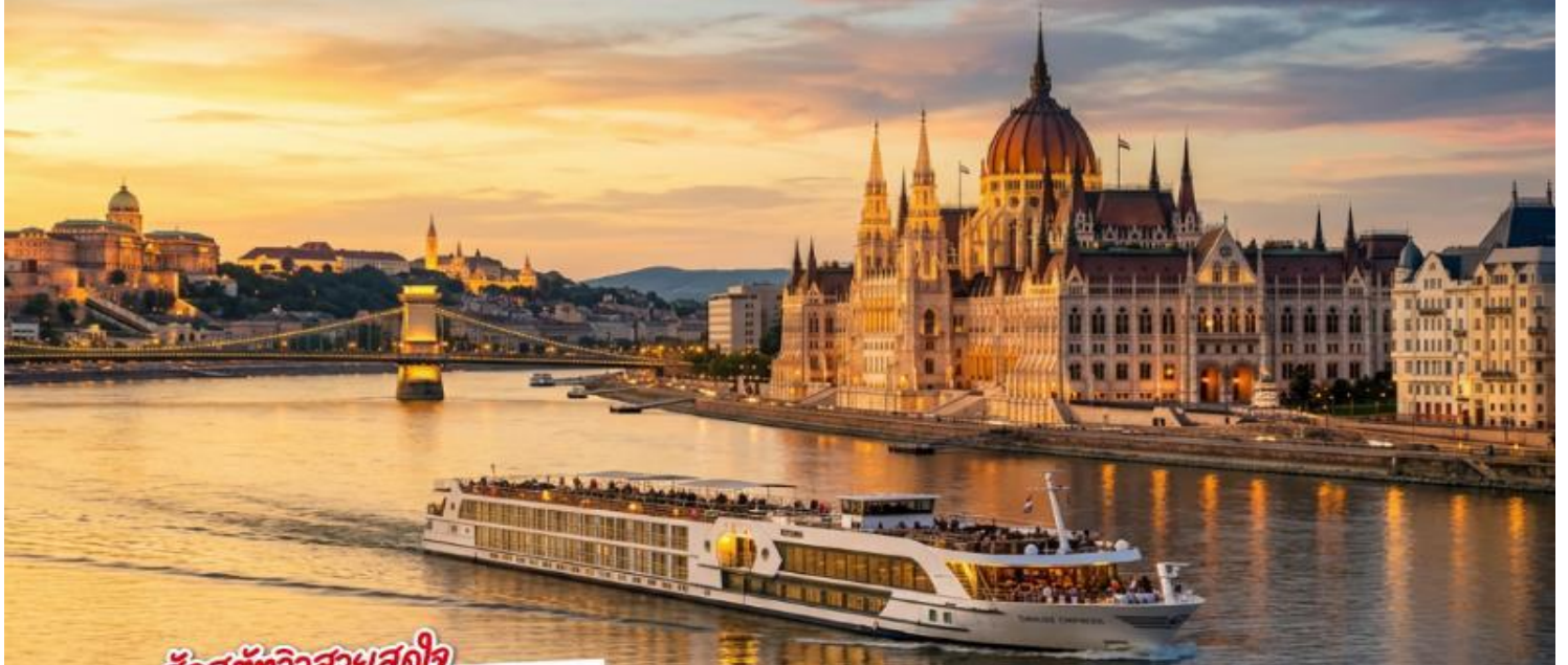
อัลสตัทิวสวสคูไล