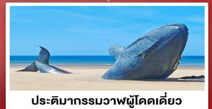
ประติมากรรมวาฬผู้โดดเดี่ยว