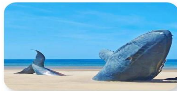
ประติมากรรมวาฬผู้โดดเดี่ยว