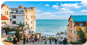
ถนนคนเดินเฟิงหลิงหมายเลขแปด