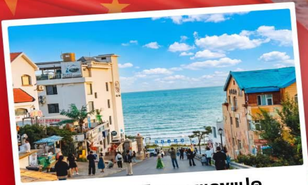
ถนนคอปเปลิงหมายเลขแปด