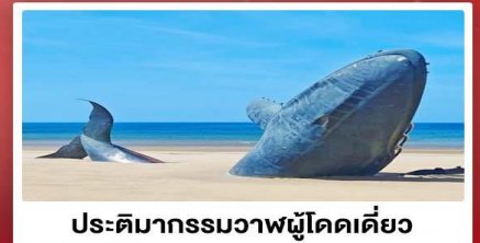
ประติมากรรมวาฬผู้โดดเดี่ยว