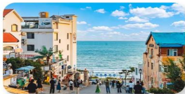
ถนนคนเดินเฟิงสายที่แปด