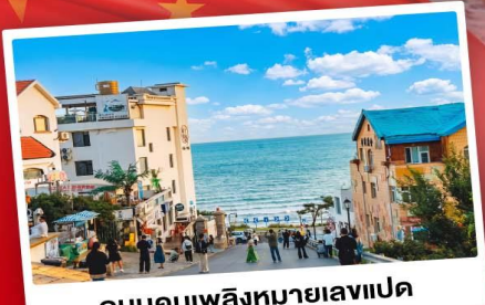
ถนนคอบเพลิงหมายเลขแปด