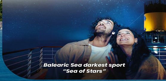
Balearic Sea darkest sport "Sea of Stars"