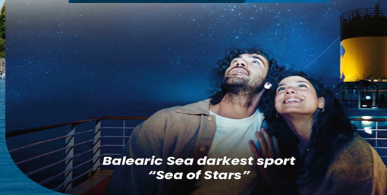
Balearic Sea darkest sport "Sea of Stars"