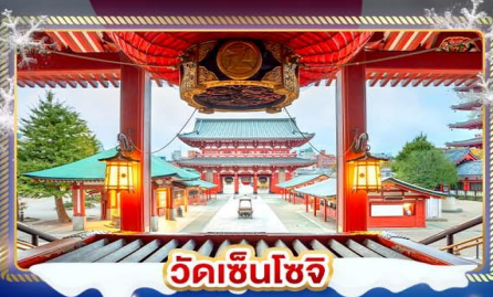
วัดเซ็นโซจิ

เที่ยวชมงานประดับไฟฤดูหนาว SAGAMIKO ILLUMINATION เช็กอินลานสกี ชมวิวภูเขาไฟฟูจิ