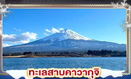
ทะเลสาบคาวากุจิ