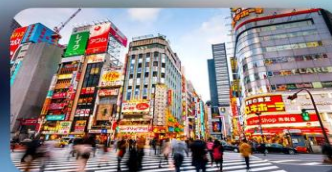
ซ้อปปิ้งชินจุกุ