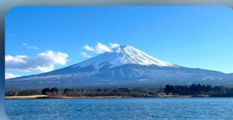
ทะเลสาบคาวากุจิ