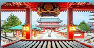
วัดเซ็นโซจิ

HOTEL HEDISTAR NARITA หรือเทียบเท่ามาตรฐานญี่ปุ่น