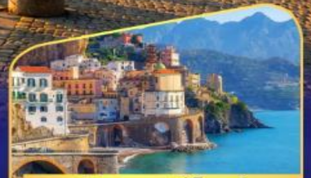
ชมวิวมัลฟีโคสต์