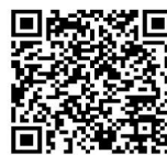
สแกน QR Code เพื่อรับข้อมูลสถานที่ใน OUTLET