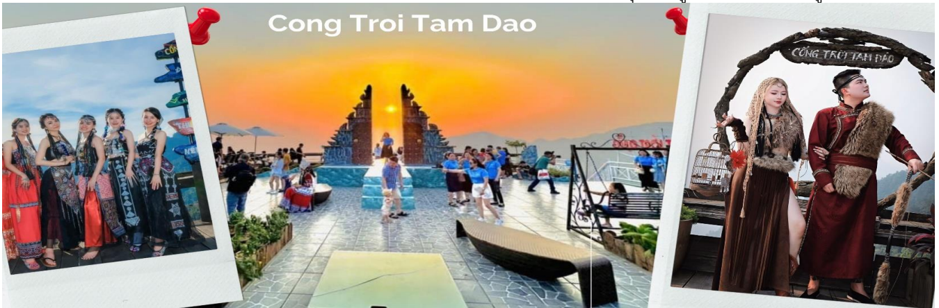
Cong Troi Tam Dao

นำท่านชม ร้านค้าเฟ้ Cong Troi Tam Dao คือหนึ่งในจุดเช็คอินที่โดดเด่นที่สุดในเมืองตามด้าวตั้งอยู่บนยอดเนินเขาที่สามารถมองเห็นวิวเมืองตามด้าวได้ทั้งเมือง สถาปัตยกรรมที่นี่ มีกลิ่นอายแบบยุโรปคลาสสิกด้วย ชุมประตุนหิน ทรงโค้งที่ตั้งตระหง่านอยู่ริมหน้าผา เปรียบเสมือนกรอบรูปขนาดยักษ์ที่ล้อมรอบทิวทัศน์ของขุนเขาและทะเลหมอกเอาไว้ โดยเฉพาะในช่วงเช้าและช่วงเย็นที่หมอกจะไหลผ่านซุ้มประตู ทำให้บรรยากาศดูลึกลับ