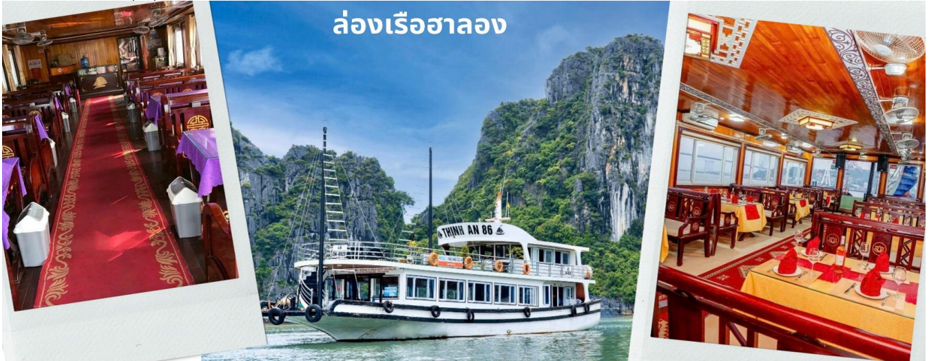
ล่องเรือฮาลอง

เช้า รับประทานอาหารเช้า ณ ห้องอาหารของโรงแรม (7) ท่าน ล่องเรือชมอ่าวฮาลองเบย์ ที่มีพื้นที่กว้างใหญ่กว่า 1,500 ตารางกิโลเมตร อยู่ทางตอนเหนือของเวียดนาม และเป็นส่วนหนึ่งในอ่าวตังเกี๋ย มีชายฝั่งยาวเป็นระยะทางกว่า 120 กิโลเมตร ท่านจะพบกับวิวทิวทัศน์ หันมองไปทางไหนก็สวยงาม เห็นผืนน้ำสีเขียวสวยและหมู่เกาะหินปูนน้อยใหญ่โผล่ขึ้นมาจากผืนน้ำทะเลที่มีลักษณะแตกต่างกันออกไป ถือเป็นสถานที่ที่ชมธรรมชาติของเวียดนามอีกแห่งหนึ่งที่สามารถดึงดูดนักท่องเที่ยวมากมายจากทั่วโลกให้มาเยือนสถานที่แห่งนี้