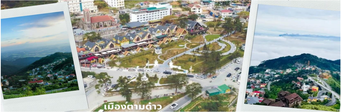
เมืองตามด้าว

สงบ ธรรมชาติอุดมสมบูรณ์ เหมาะกับคนที่อยากหนีร้อนจากในเมืองมาพักผ่อนชิลๆ และที่นี้ยังถูกเรียกว่า Little Sapa และ ดาลัดแห่งภาคเหนือ เนื่องจากเป็นเมืองกลางสายหมอกในหุบเขา และมีความเป็นยุโรปคล้ายกับซาปา