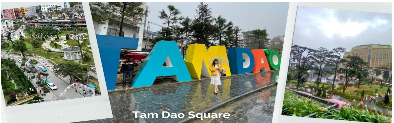
Tam Dao Square

นำท่านสู่ จัตุรัสตามด้าว ตั้งอยู่ใจกลางเมือง โดดเด่นด้วยน้ำพุขนาดใหญ่ รายล้อมไปด้วยร้านค้า ร้านอาหาร โรงแรม และคาเฟ่มากมาย บางวันมีการแสดงดนตรีสดให้ได้ชม บรรยากาศคึกคักมาก และไฮไลท์ที่พลาดไม่ได้ก็คือ ป้ายขนาดใหญ่ที่เขียนว่า “ Tam Dao ” เป็นจุดที่นักท่องเที่ยวนิยมมาถ่ายรูปกัน ถือเป็นการเช็คอินว่ามาถึงตามด้าวแล้ว