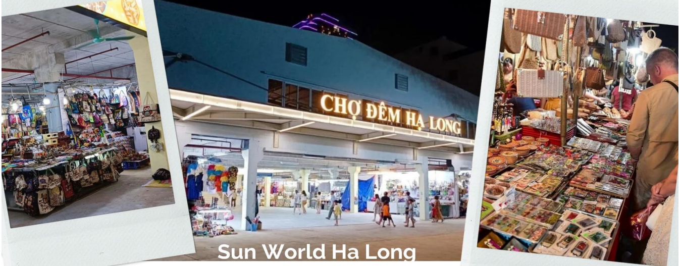
Sun World Ha Long

จากนั้นนำท่านไป ตลาดกลางคืนฮาลอง ไม่เพียงแต่เป็นสวรรค์แห่งอาหารและการช้อปปิ้งเท่านั้น แต่ยังเป็นสถานที่ที่เก็บรักษาจิตวิญญาณทางวัฒนธรรมของดินแดนแห่งมรดกโลกกว้างนิญอีกด้วย ที่นี่ นักท่องเที่ยวจะได้สัมผัสกับบรรยากาศที่คึกคัก ลิ้มลองอาหารท้องถิ่นรสเลิศ และเลือกซื้อของที่ระลึกที่สะท้อนถึงความเป็นทะเลอย่างแท้จริง ทุกมุมของตลาดล้วนซ่อนเร้นเสน่ห์อันเป็นเอกลักษณ์ – ตั้งแต่กลิ่นหอมเย้ายวนของอาหารปิ้งย่าง เสียงจอแจของการซื้อขาย ไปจนถึงแสงไฟระยิบระยับที่สะท้อนบนพื้นถนนยามค่ำคืน