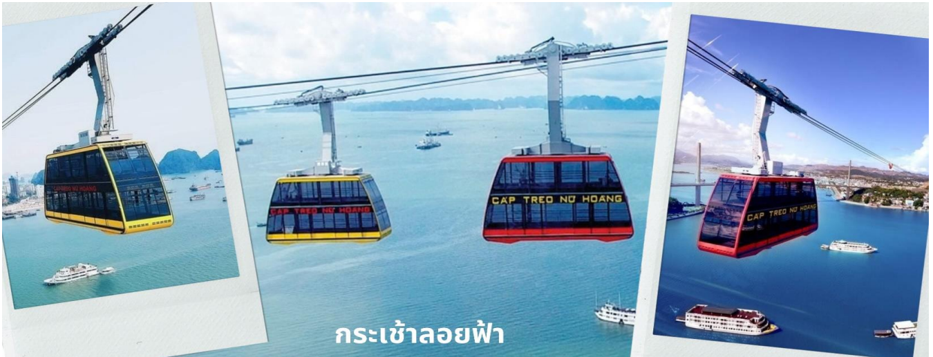
กระเช้าลอยฟ้า

จากนั้นนำท่านนั่ง Queen Cable Car กระเช้าลอยฟ้า 2 ชั้นที่ใหญ่ที่สุดในโลก จุคนได้มากถึง 250 คนต่อเที่ยว สามารถรับ-ส่งผู้โดยสารได้มากถึง 2,000 คนต่อชั่วโมง กระเช้าลอยฟ้า 2 ชั้นยิ่งใหญ่อลังการนี้เป็นส่วนหนึ่งของสวนสนุก Sun World Halong Park สร้างโดย Doppelmayr/Garaventa Group จากประเทศสวิตเซอร์แลนด์และออสเตรเลีย โดยมีความพิเศษที่สามารถทำลายสถิติโลก และได้รับการบันทึกลงใน Guinness World Records ถึง 2 รายการ คือ เป็นกระเช้าที่จุคนได้มากที่สุดในโลก และมีเสาคอนกรีตส่งกระเช้าที่สูงที่สุดในโลก ด้วยความสูงถึง 188.88 เมตร