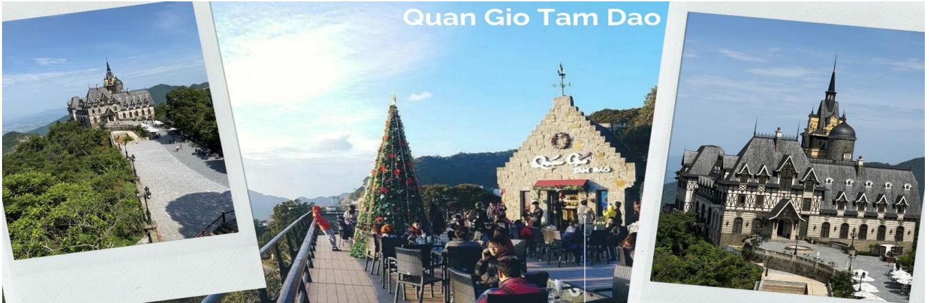
Quan Gio Tam Dao

นำท่านไปชมวิวยาวๆ กันที่ สะพานเมฆตามด้าว เป็นหนึ่งในจุดถ่ายรูปและจุดชมวิวยอดนิยม โดยเป็นสะพานไม้สูง 20 เมตร ทอดยาวเป็นทางเดินออกไปบนไหล่เขาในระยะทาง 50 เมตร เชื่อมภูเขาเล็กๆ สองลูกเข้าด้วยกัน สามารถเพลิดเพลินไปกับทัศนียภาพอันงดงามของหุบเขาเขียวขจี เมฆขาวลอยฟุ้ง สัมผัสถึงความเงียบสงบและความงดงามของสถานที่แห่งนี้ เมื่อเวลาที่มีทะเลหมอกจะเหมือนกับว่าได้เดินอยู่ท่ามกลางเมฆจริงๆ บอกเลยว่าบรรยากาศดีมากๆ จากนั้นนำท่านสู่สถานอวย (ใช้ระยะเวลาประมาณ 1 ชม 30 นาที)