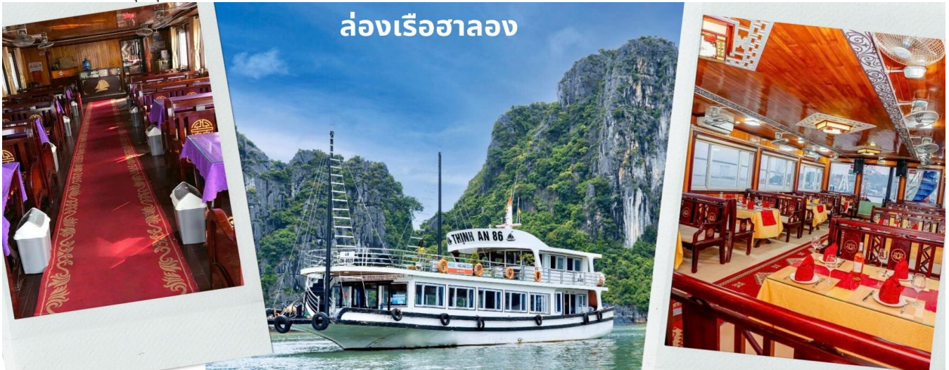
ล่องเรือฮาลอง

เช้า รับประทานอาหารเช้า ณ ห้องอาหารของโรงแรม (7) ท่าน ล่องเรือชมอ่าวฮาลองเบย์ ที่มีพื้นที่กว้างใหญ่กว่า 1,500 ตารางกิโลเมตร อยู่ทางตอนเหนือของเวียดนาม และเป็นส่วนหนึ่งในอ่าวตังเกี๋ย มีชายฝั่งยาวเป็นระยะทางกว่า 120 กิโลเมตร ท่านจะพบกับวิวทิวทัศน์ หันมองไปทางไหนก็สวยงาม เห็นผืนน้ำสีเขียวสวยและหมู่เกาะหินปูนน้อยใหญ่โผล่ขึ้นมาจากผืนน้ำทะเลที่มีลักษณะแตกต่างกันออกไป ถือเป็นสถานที่เที่ยวชมธรรมชาติของเวียดนามอีกแห่งหนึ่งที่สามารถดึงดูดนักท่องเที่ยวมากมายจากทั่วโลกให้มาเยือนสถานที่แห่งนี้