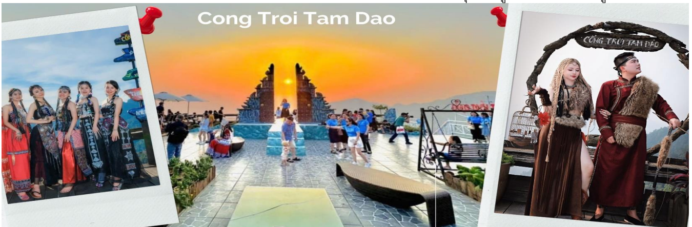
Cong Troi Tam Dao

นำท่านชม ร้านกาแฟ Cong Troi Tam Dao คือหนึ่งในจุดเช็คอินที่โดดเด่นที่สุดในเมืองตามด้าวตั้งอยู่บนยอดเนินเขาที่สามารถมองเห็นวิวเมืองตามด้าวได้ทั้งเมือง สถาปัตยกรรมที่นี่ มีกลิ่นอายแบบยุโรปคลาสสิกด้วย ชุมประตุนหิน ทรงโค้งที่ตั้งตระหง่านอยู่ริมหน้าผา เปรียบเสมือนกรอบรูปขนาดยักษ์ที่ล้อมรอบทิวทัศน์ของขุนเขาและทะเลหมอกเอาไว้ โดยเฉพาะในช่วงเช้าและช่วงเย็นที่หมอกจะไหลผ่านชุมประตุนหิน ทำให้บรรยากาศดูลึกลับ