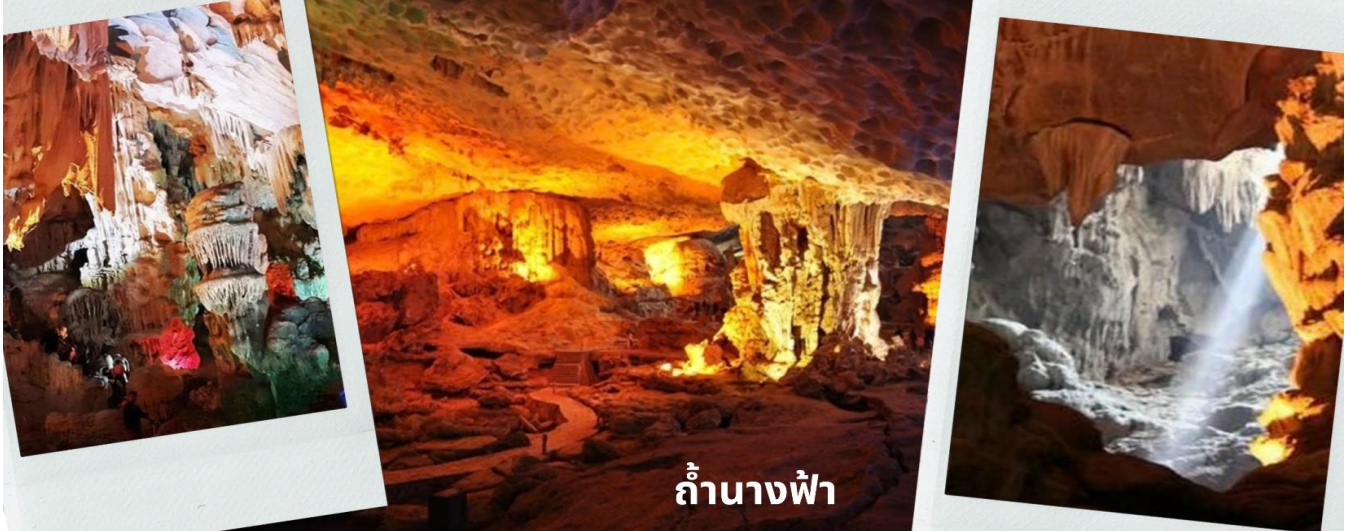
ถ้ำนางฟ้า

จะเห็นได้ว่าหินงอกหินย้อยต่าง ๆ นั้นจะมีลักษณะรูปทรงแตกต่างกันออกไปตามแต่ท่านจะจินตนาการ ขึ้นอยู่ว่าแต่ละท่านจะตีความออกมาว่าเป็นรูปทรงเหมือนสิ่งใด ในถ้าเราจะเห็นหินรูปนางฟ้าที่ถูกสร้างขึ้นมาจากทางธรรมชาติที่ติดอยู่ภายในผนังถ้ำ นับว่าเป็นสิ่งมหัศจรรย์อย่างหนึ่งและมีตำนานเล่าขานกันว่า มีเหล่านางฟ้าเข้ามาอาบน้ำในถ้ำแห่งนี้และเกิดหลงไหลชายหนุ่มผู้ที่เป็นมนุษย์เลยคิดที่จะไม่ยอมกลับสวรรค์ จนกระทั่งเวลาผ่านไปล่วงเลยไปกลุ่มนางฟ้าทั้งหลายเลยกลายเป็นหินติดอยู่ที่ผนังถ้ำอย่างน่าอัศจรรย์