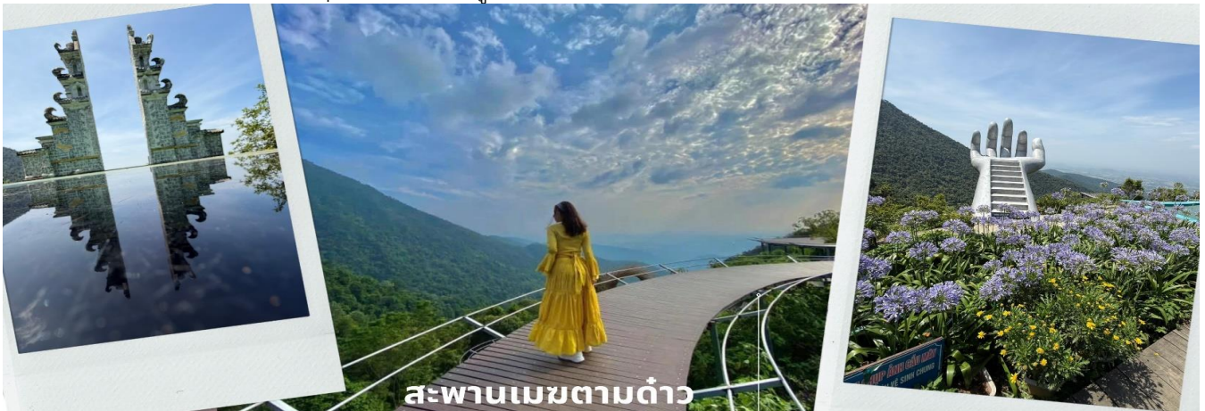
สะพานเมฆตามด้าว

นำท่านไปชมวิวยาวๆ กันที่ สะพานเมฆตามด้าว เป็นหนึ่งในจุดถ่ายรูปและจุดชมวิวยอดนิยม โดยเป็นสะพานไม้สูง 20 เมตร ทอดยาวเป็นทางเดินออกไปบนไหล่เขาในระยะทาง 50 เมตร เชื่อมภูเขาเล็กๆ สองลูกเข้าด้วยกัน สามารถเพลิดเพลินไปกับทัศนียภาพอันงดงามของหุบเขาเขียวขจี เมฆขาวลอยฟุ้ง สัมผัสถึงความเงียบสงบและความงดงามของสถานที่แห่งนี้ เมื่อเวลาที่มีทะเลหมอกจะเหมือนกับว่าได้เดินอยู่ท่ามกลางเมฆจริงๆ บอกเลยว่าบรรยากาศดีมากๆ จากนั้นนำท่านสู่สถานอวย (ใช้ระยะเวลาประมาณ 1 ชม 30 นาที)