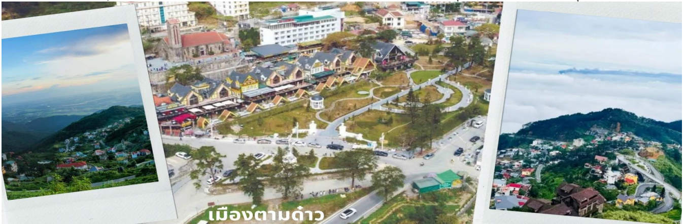
เมืองตามด้าว

สงบ ธรรมชาติอุดมสมบูรณ์ เหมาะกับคนที่อยากหนีร้อนจากในเมืองมาพักผ่อนชิลๆ และที่นี้ยังถูกเรียกว่า Little Sapa และ ดาลัดแห่งภาคเหนือ เนื่องจากเป็นเมืองกลางสายหมอกในหุบเขา และมีความเป็นยุโรปคล้ายกับซาปา