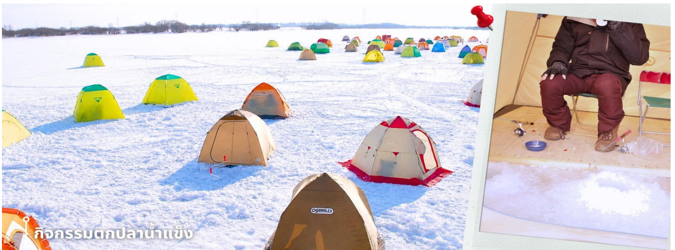
กิจกรรมตกปลาน้ำแข็ง

หลังรับประทานอาหารเที่ยง พาท่านทำกิจกรรมสุดฮิต กับ กิจกรรมตกปลาน้ำแข็ง (รวมค่าอุปกรณ์ตกปลา) กิจกรรมฤดูหนาวยอดนิยมของญี่ปุ่น กับการตกปลาน้ำแข็งท่ามกลางบรรยากาศธรรมชาติที่ปกคลุมด้วยหิมะสีขาว โดยในช่วงฤดูหนาว ผิวน้ำของทะเลสาบจะกลายเป็นแผ่นน้ำแข็งขนาดใหญ่ เปิดโอกาสให้นักท่องเที่ยวได้สัมผัสประสบการณ์ตกปลากลางอากาศหนาวแบบดั้งเดิมของญี่ปุ่น ท่ามกลางบรรยากาศหิมะสีขาวและอากาศหนาวเย็นแบบญี่ปุ่นแท้ ๆ ท่านจะได้ลองตกปลาด้วยตัวเองบนผืนน้ำแข็งขนาดใหญ่ พร้อมดื่มด่ำกับวิวธรรมชาติอันเงียบสงบ