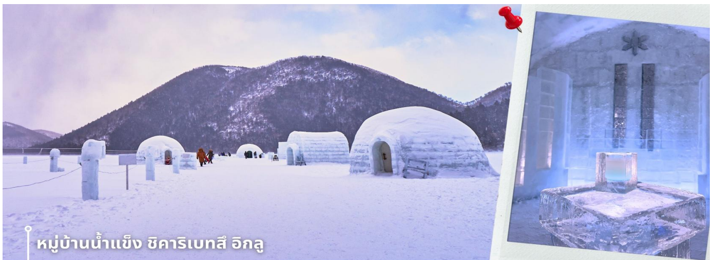
หมู่บ้านน้ำแข็ง ชิคาริเบตสึ อิกลู

เช้า รับประทานอาหารเช้าที่ โรงแรม (4) หลังรับประทานอาหารเช้า นำท่านเดินทางสู่ เมืองชิคาโออิ เพื่อพาท่านสู่ หมู่บ้านน้ำแข็งชิคาริเบตสึ อิกลู อยู่ที่ ทะเลสาบชิคาริเบตสึ (Lake Shikaribetsu) เป็นทะเลสาบธรรมชาติที่ตั้งอยู่ภายในอุทยานแห่งชาติไดเซ็ตสึซัง บน เกาะฮอกไกโด โดดเด่นด้วยธรรมชาติอันเงียบสงบ รายล้อมด้วยภูเขาและผืนป่า พร้อมอากาศหนาวเย็นที่ปกคลุม พื้นที่ในช่วงฤดูหนาว จนกลายเป็นหนึ่งในจุดท่องเที่ยวฤดูหนาวที่มีชื่อเสียงของฮอกไกโด ในช่วงฤดูหนาว บริเวณ ทะเลสาบจะถูกเนรมิตให้กลายเป็น “หมู่บ้านน้ำแข็งชิคาริเบตสึ อิกลู” หรือ Shikaribetsu Kotan หมู่บ้านน้ำแข็งที่ สร้างขึ้นจากหิมะและน้ำแข็งจริงโดยน้ำแข็งจะมีความใสเป็นพิเศษเนื่องจากน้ำในทะเลสาบแห่งนี้ได้ชื่อว่าเป็นน้ำที่ ใสบริสุทธิ์อีกแห่งหนึ่งในฮอกไกโด ภายในงานสามารถเดินชมบ้านอิกลู คาเฟ่ น้ำแข็ง โบสถ์น้ำแข็ง รวมถึงมุมถ่ายรูป สุดสวย สร้างบรรยากาศราวกับเมืองน้ำแข็งกลางหุบเขาหิมะ นอกจากนี้ยังมีกิจกรรมฤดูหนาวหลากหลาย อย่างการ แช่ออนเซ็นกลางแจ้งริมทะเลสาบ (ไม่รวมค่าแช่ออนเซ็น) ท่ามกลางวิวหิมะสีขาวอันเงียบสงบ ถือเป็นอีกหนึ่ง ประสบการณ์ฤดูหนาวอันเป็นเอกลักษณ์ของฮอกไกโดที่ไม่ควรพลาด