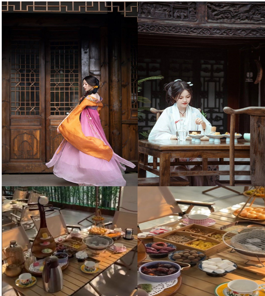
กับสะพานโค้งและตึกเก่า,นั่งจิบชา (Tea Break) ชมวิวริมน้ำ ต้มต้บรยากาศสุดโรแมนติก

(พิเศษ! รวมค่าใส่ชุดจีนโบราณ แพลงโจมเป็นหนุ่มสาวชาววังด้วย ชุดจีนโบราณ (Hanfu) เดินถ่ายรูป