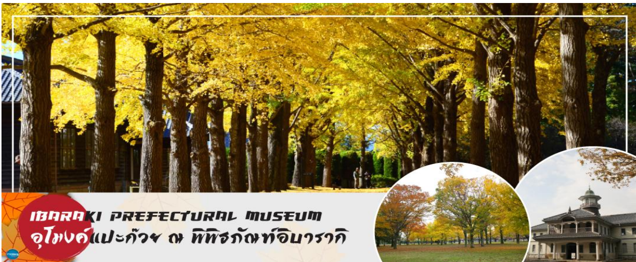
IBARAKI PREFECTURAL MUSEUM อุโมงค์แปะก๊วย ณ พิพิธภัณฑ์อิบารากิ

วันที่สาม เมืองมิโตะ – อุโมงค์แปะก๊วย ณ พิพิธภัณฑ์ประวัติศาสตร์อิบารากิ – จังหวัดไซตามะ – ย่านเมืองเก่าคาวะโกเอะ – ดรอกลูกกวาด – จังหวัดยามานาชิ – จุดชมวิวฟูจิ คิราระ โคริว พลาซ่า – ออนเซ็น + ชาบูยักษ์