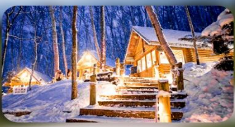
นิงเกิ้ลเทอเรส