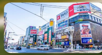
ซูซุกิโนะ