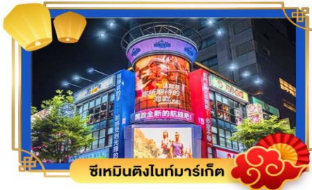
ซีเหมินติงไนท์มาร์เก็ต