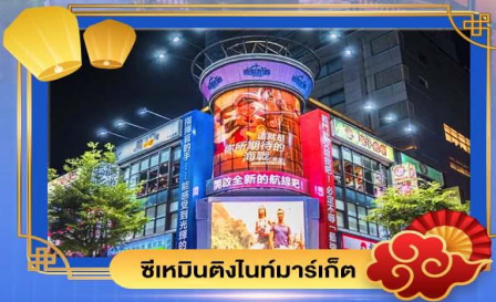
ช้อปปิ้งในท์มาร์เก็ต