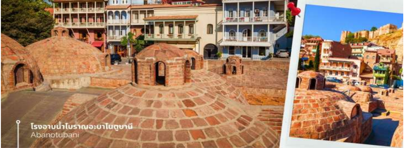
โรงอบน้ำโบราณอะบาโนตูปานี Abanotubani

จากนั้นเดินทางสู่เมืองเก่าจอร์เจียมชเคตา