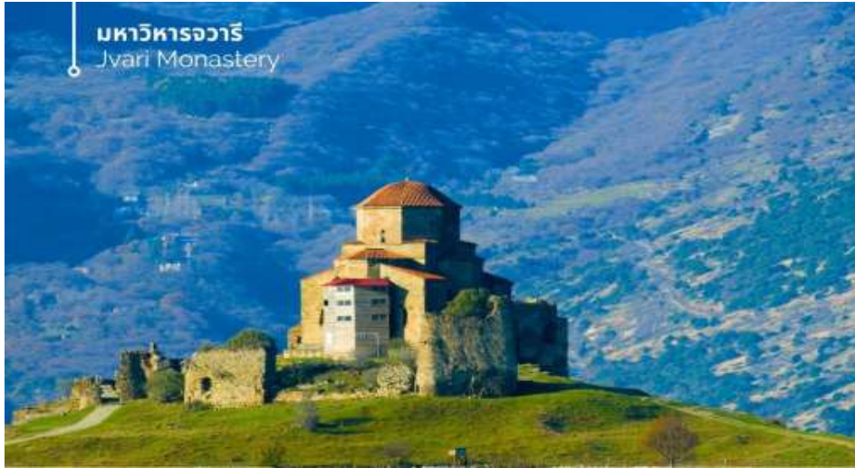
มหาวิหารจวารี Jvari Monastery