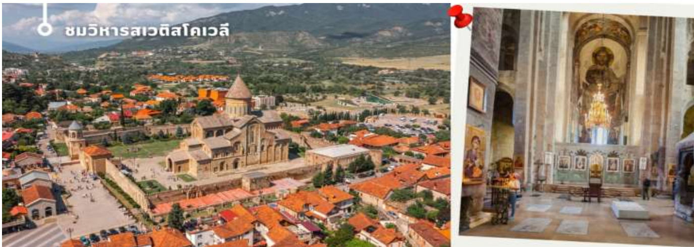
ชมวิหารสเวตสโคเวลี

นำท่านออกเดินทางชม วิหารสเวตสโคเวลี (Svetitskhoveli Cathedral) โบสถ์เก่าแก่ที่ถือเป็นศูนย์กลางทางศาสนาอันศักดิ์สิทธิ์ที่สุดของจอร์เจีย มีขนาดใหญ่เป็นอันดับสองของประเทศ และเป็นศูนย์รวมจิตใจของชาวคริสต์ออร์ทอดอกซ์ สร้างขึ้นในราวศตวรรษที่ 11 ตัวโบสถ์มีสถาปัตยกรรมที่งดงามตามแบบฉบับของจอร์เจีย โดมสูงเด่นตระหง่าน บ่งบอกถึงความยิ่งใหญ่และศักดิ์สิทธิ์ ภายในวิหารประดับประดาด้วยภาพเขียนฝาผนังที่งดงามเล่าเรื่องราวทางศาสนา และยังมีหอคอยสูงที่สามารถมองเห็นวิวเมืองมิชเคตาได้อย่างสวยงาม