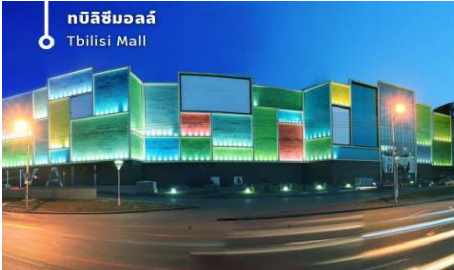
ทบิลิซิมอลล์ Tbilisi Mall