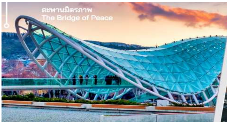
สะพานมิตรภาพ The Bridge of Peace

นำท่านเดินทางไปยัง สะพานสันติภาพ เป็นสะพานคนเดินรูปทรงโค้งสร้างจากเหล็กและ ทอดข้ามแม่น้ำคูราเชื่อมสวนริเกกกับเมืองเก่าในใจกลางกรุงทบิลิซินับตั้งแต่เปิดให้บริการในปี 2010 โครงสร้างนี้ได้กลายเป็นทางข้ามคนเดินที่สำคัญในเมืองรวมทั้งเป็นสถานที่ท่องเที่ยวที่สำคัญและเป็นหนึ่งในแลนด์มาร์คที่เป็นที่รู้จักมากที่สุดของเมืองหลวง สะพานซึ่งทอดยาว 150 เมตร ข้ามแม่น้ำคูรา ได้รับคำสั่งจากศาลว่าการเมืองทบิลิซีให้สร้างเป็นองค์ประกอบการออกแบบร่วมสมัยที่เชื่อมต่อทบิลิซีเข้ากับเขตใหม่ สะพานทอดยาวข้ามแม่น้ำคูรา ทำให้สามารถมองเห็นโบสถ์เมเตคีรูปปั้นของผู้ก่อตั้งเมืองวิกตัง กอร์กาซาลีและป้อมนาริกาลาทางด้านหนึ่งและสะพานบาราตาชวิลีและพระราชวังพิธีการของจอร์เจียทางอีกด้านหนึ่ง