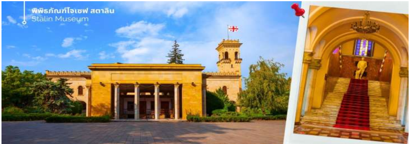
พิพิธภัณฑ์โจเซฟ สตาลิน Stalin Museum

ออกเดินทางต่อไปยังเมืองกอรี (ใช้เวลาเดินทางประมาณ 1 ชั่วโมง 20 นาที ) นำท่านเที่ยวชม พิพิธภัณฑ์โจเซฟ สตาลิน (Stalin Museum) ซึ่งที่เมืองนี้เป็นบ้านเกิดของโจเซฟ สตาลิน อดีตผู้นำสูงสุดของสหภาพโซเวียต สตาลินถูกยกย่องเป็นวีรบุรุษที่นำพาสหภาพโซเวียตให้รุ่งเรือง แต่ในขณะเดียวกันก็เป็นที่รู้จักในด้านการกดขี่ข่มเหงและการฆ่าล้างเผ่าพันธุ์ พิพิธภัณฑ์แห่งนี้จึงเป็นแหล่งเรียนรู้เกี่ยวกับชีวิตและผลงานของสตาลิน รวมถึงผลกระทบที่เขามีต่อประวัติศาสตร์โลก