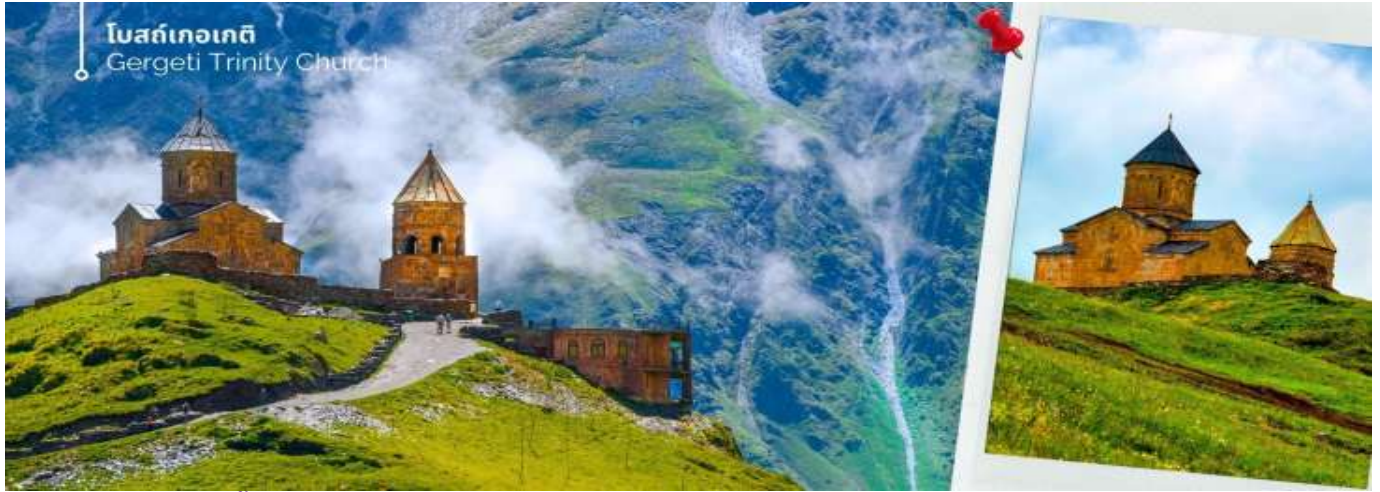
โบสถ์เทอเกตี Gergeti Trinity Church

จากนั้นออกเดินทางสู่ เมืองกูตาอูรี (ใช้เวลาเดินทางประมาณ 1 ชั่วโมง 30 นาที)